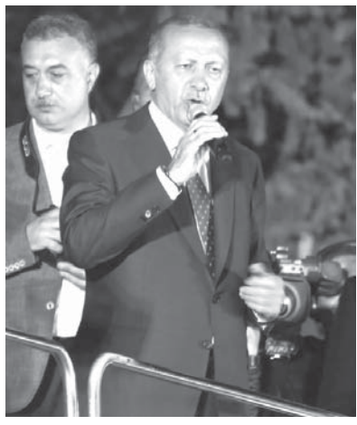
トルコ大統領選での勝利宣言後、支持者の前で姿を見せたエルドアン大統領(24日、イスタンブール)

【アンカラ共同】24日実施のトルコ大統領選で、選挙管理委員会は25日未明、現職のエルドアン大統領(64)が過半数を得票し、再選された。中東の地域大国トルコは、昨年承認の憲法改正により選挙後、議院内閣(一院制、600議席)に でも与党連合が勝利したと語った。トルコの民主化後退や人権問題に懸念を強める欧米との関係が一層緊張する可能性がある。シリア内戦への介入など、近年の対外強硬路線が継続され、中東情勢にも影響を与えそうだ。エルドアン氏は「民主主義の勝利だ」と演説。大統領選を「早急で理想的な形で実行すると、国の将来に集中する