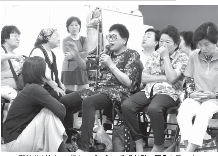
高齢者交流クラブ「トラチの会」で戦争体験を語る在日コリアン1世たち(19日午後、川崎市)

【ロンドン共同】日本ラグビーのワールドカップ(W杯)が開かれるのを前に、「ラグビーの聖地」と呼ばれるロンドン郊外トゥイックナム競技場の「ワールド・ラグビー博物館」で11月15日から、日本ラグビーをテーマにした特別展が始まる。来年 今年11月17日には、同競技場でイングランド対日本代表戦が行われる予定で、同博物館は「応援に来る日本のファンには是非見てほしい」と呼びかけている。 英国発祥のスポーツ、ラグビーに関する3万8千点以上の展示品がある