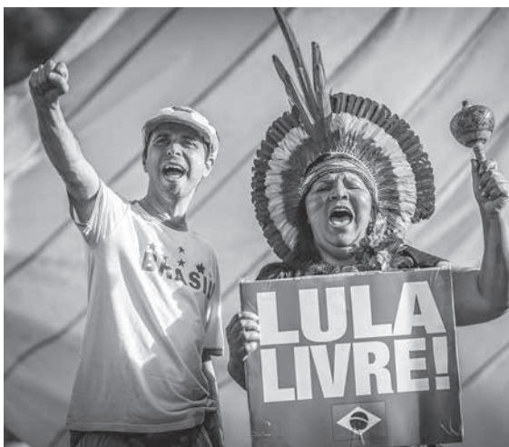
「ルーラを自由に」のプラカードをサッカー応援中にも掲げる人々(参考画像・Ricardo Stuckert)

ルーラ氏は、聖州沿岸部グアラジャリ市の高級三層住宅に伴う収賄、資金洗浄の罪に問われ、今年1月に、2審担当の第4連邦地域裁(TRF14)で禁錮12年1カ月の有罪判決を受けた。また、再度、意義を申し立て、24日にTRF14に同伴を高等裁(STJ)に送ることを決定した。