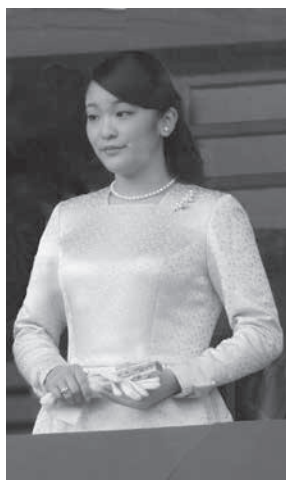
眞子さま

秋篠宮ご夫妻の長女・眞子さまが7月17日から31日までの日程で、ブラジルを公式訪問される。22日の閣議で正式決定された。外国公務は昨年10月に続き4回目。18日にリオに到着され、28日迄に5州14都市を巡られる予定。各地開催のブラジル日本移民110周年記念式典などにご臨席されるなど、日系人との交流を深められる。コロナ希望の眞子さまご来伯まで残り1カ月迫るなか、各地では最終調整の真つ最中だ。この日程は、宮内庁発表の日時と訪問地に本紙が取材した各地での詳細を加えたもの。今後、変更される可能性がある。