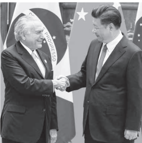
テメル大統領(左)と習近平総書記(右)

伯国のインフラ事業に考えた後に、『では、積極的に進出している中国の国に投資しようか』と国企業、中国交通建設股份有限公司(CCCC)と協力関係にある投資銀行、モタル銀行の共同経営者エドゥアルド・セントーラ氏は、「中国人はどの国と友好関係を結ぶか」と