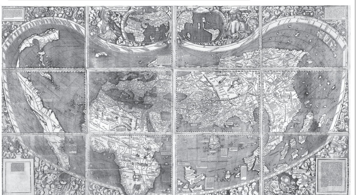
ヴァルトゼーミューラー地図、1507年。経度と緯度を正確に図表で表した最初の地図の一つであり、また初めて「アメリカ」という名称を用いた地図。アメリカ、アフリカ、ヨーロッパ、そしてアジアが描かれている

「共同」不登校の子どもの声を生かす。編集方針に「当事者の視点」を掲げて刊行してきた「不登校新聞」が今年、創刊20周年を迎えた。当事者の思いや意見を伝えるべく、20年間は820部まで減り、現在は1部、不登校の子どもの孤立感や不安を解消するべく、さまざまな取り組みを推進している。編集部は「不登校新聞は毎月2回発行、紙版とウェブ版があり、問い合わせは全国不登校新聞社、電話03(5963)5526」。