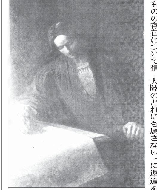
19世紀に描かれたマルティン・ヴァルトゼーミューラの肖像画