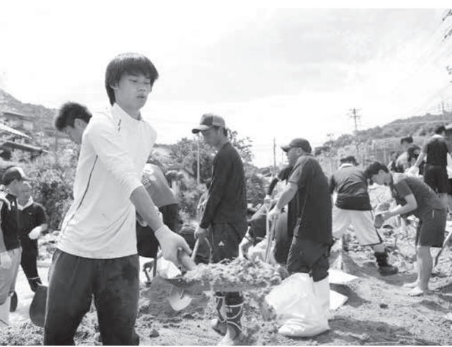
土砂を撤去する住民やボランティア=11日午前10時8分、広島市安芸区矢野東

菅義偉官房長官は記者会見で、死者が計176人に上ったことを明らかにしている。共同通信の各府県まとめで死者は12府県で計174人。被災地では厳しい暑さの