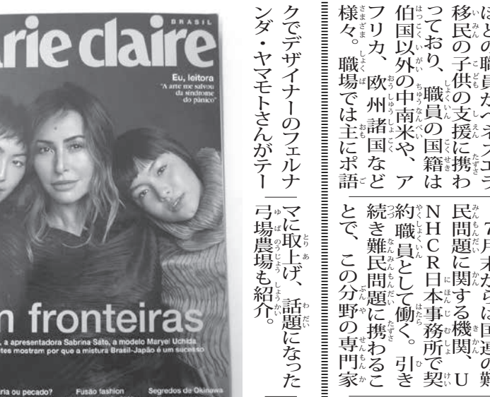
山根県大隊救助活動の様子 (呉市天応西条3丁目地区) (撮影=緊急消防援助隊山根県大隊、出典:消防庁ホームページ (http://www.fdma.go.jp/)) を加工して作成

平崎会長「できることをやる」 総務省消防庁災害対策本部により、平成30年7月豪雨(西日本豪雨)の被害状況は11日午後1時45分(日本時間)で死者数は168人、行方不明者は約57人、と発表された。昨日同時刻の発表から、避難所・避難者数は減ったものの、死者、行方不明者数は増加している。