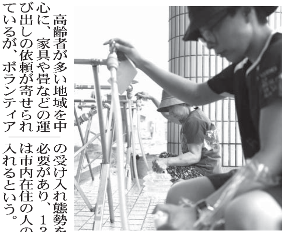
岡山県倉敷市真備町地区に設置された給水所を利用する人

【共同】西日本豪雨の被災地では、11日も朝から強い日差しが照りつける。一部地域ではボランティアの受け付けが順次始まり、家屋の片付けや土砂の撤去を手伝おうと、100人を超える人が長蛇の列を作ったが受け入れ態勢が整わず、一部で活動が制限された。一方、断水は多くの世帯で続き、水を求める被災者が給水所に集まった。岡山県倉敷市の受付には朝から、帽子や長靴、マスクを身に付けたボランティア姿のボランティアが次々と詰め掛けた。気温は午前11時前に30度を超え、炎天下、一帯