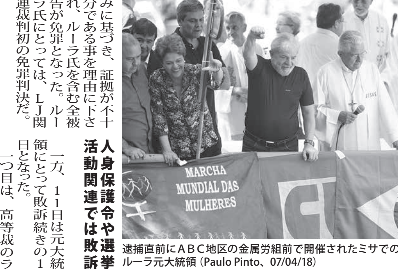
逮捕直前にABC地区の金属労組前で開催されたミサでのルラ元大統領 (Paulo Pinto, 07/04/18)

【ルラ元大統領】の報酬を払う代わりに、当時の政権の中核にいたルラ元大統領の秘書長ジョゴ・フェレイラ氏だ。ルラ元大統領はルラ氏が関与したとされる起訴第1号だったが、昨年9月には検察側が、ルラ氏とステヴェス氏に関しては十分な証拠がないので免罪とするよう申し入れていた。12日の判決は、検察の言い分通り、同伴の起訴が録音と報復供述の