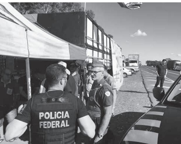
5月末に発生したトラックストは伯国社会に大きな影響を与えた。

【既報関連】連邦上院と下院は11日、トラック輸送の最低運賃を定めた暫定令(MP)を承認した。このMPでは、5月21日から6月4日までのスト期間中に、道路からトラックを取り除かれた個人トラック業者や、ストを支援した運送会社に科された罰金を免除することも定められており、テメル大統領の裁可待ちと、12日付付字各紙が報じた。ただし、総弁護庁(AGU)は、裁判所が出した罰金をMPで免除する事は憲法違反として争う。