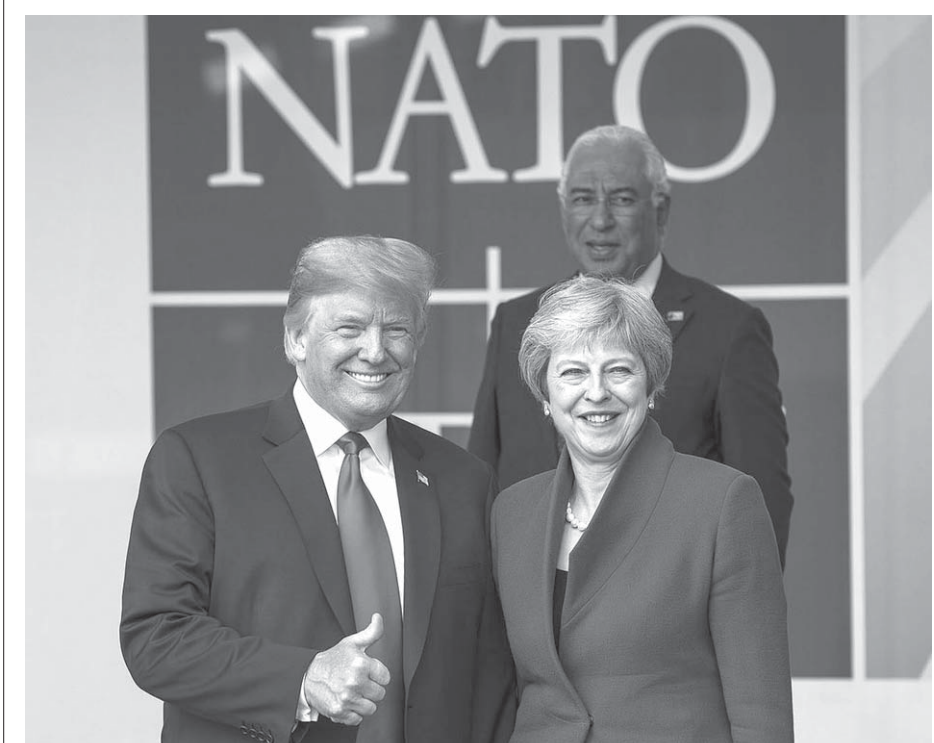
トランプ大統領、北大西洋条約機構(NATO)の会議で、メイ英国首相と