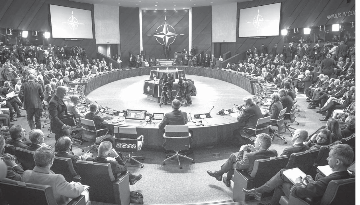
北大西洋条約機構(NATO)の会議の様子。ポルトガル語圏等ではOTAN

トランプ政権の目標は、米朝の覇権体制の解体だ。第2次大戦後に米朝が覇権国になって以来、米朝の運営は英国イスラエルG7など同盟諸国と米朝の軍産に牛耳られ、同盟国や軍産が好む世界的な対立構造(東西冷戦、米欧イスラエル対イスラム世界)に恒久的に陥れられ、対立構造