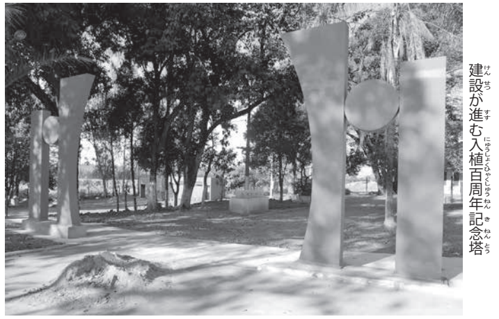
建設が進む入植百周年記念塔。真子さまご訪問への期待の声を聞いた。

上塚植民地入植100周年を迎える聖州プロミソンでは、移民100周年をかねた一大祭典の最終準備が、ねじり鉢巻で進められている。22日午後6時から開催される記念式典には、真子内親王殿下がご臨席され、ノロエステ連合傘下34支部や同地出身者の子孫も合わせ1万人以上の来場客が見込まれている。7日、現地を二足先に訪問し、準備状況とともに、真子さまご訪問への期待の声を聞いた。