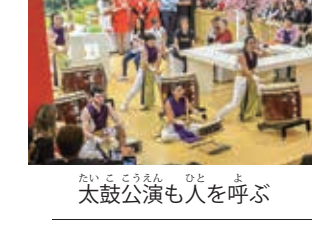
太鼓公演も人を呼ぶ