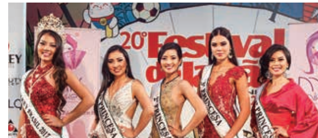
昨年のミス・ニッケイコンテストの様子