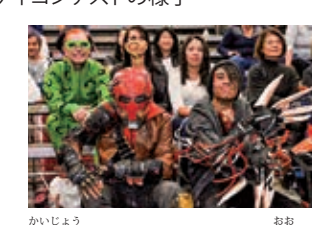
会場にはコスプレヤーも多い