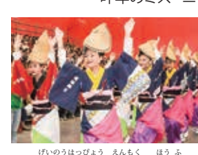
芸能発表も演出が豊富