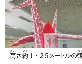
高さ約1・25メートルの鶴