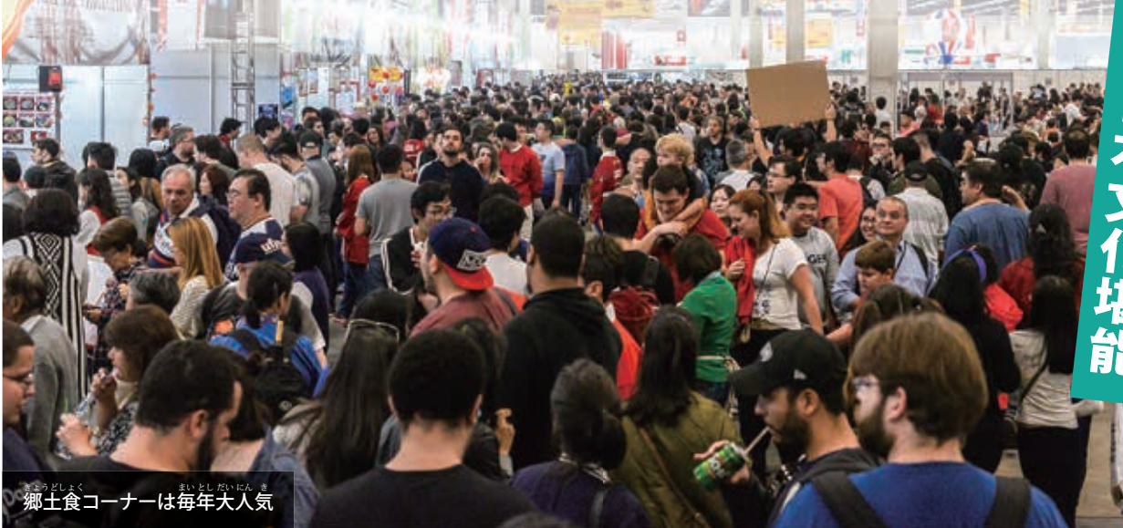
郷土食コーナーは毎年大人気

ブラジル日本都道府県人会主催の日本祭りが来週末、サンパウロEXPOセンター (Rodovia dos Imigrantes km 1,5) で行なわれる。「ブラジル日本移民110周年」がテーマの今年は20(金)、21(土)、22日(日)の3日間開催で約20万人の来場者を見込んでいる。ブラジル日本移民110周年記念式典が会場で行われ、日本から眞子内親王殿下が出席されるので、日本からの注目も集めそうだ。毎年多くの人々が楽しみにしている日本各地の郷土料理のほか、日本食の種類の多さでギネス記録獲得への挑戦、またコスプレやミス・ニッケイ、日本文化体験コーナー、高齢者コーナーなど、全年齢が楽しめる企画が盛り沢山だ。