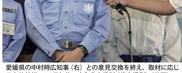
愛媛県の中村時広知事(右)との意見交換を終え、取材に応じる安倍首相＝13日午後、宇和島市役所(代表撮影) (共同)

働く人のうち育児中の人は881万人、介護中の人は346万人で、いずれも前回より増えた。産業別にみた働く人の数は製造業が最多で1053万人、卸売・小売業1012万人、医療・福祉816万人、建設業490万人と続いた。調査は15歳以上の男