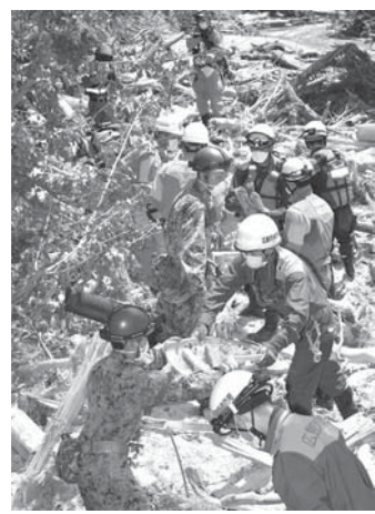
土砂を取り除く消防隊員と自衛隊員ら。13日午前11時13分、広島市安芸区矢野東

【共同】西日本を中心とした豪雨で発生し、住宅や公共施設などに被害を及ぼした土砂災害が、国土交通省の集計で31道府県計619件に上ったことが13日分かった。同日午前4時現在、広島県が123件と最多で、愛媛県59件、兵庫県11件と続く。甚大な被害が出ている広島県などでは実態把握が十分ではないとみられ、同省も、件数はさらに増える可能性があるとしている。