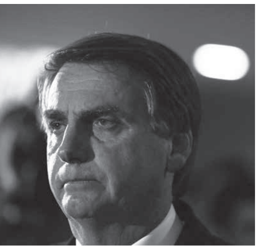
ボウソノロ氏

連中中のルーラ氏(労働者党・PT)抜きの場合に大統領選世論調査1位のジャイル・ボウソノロ氏(社会自由党・PSL)が、18日に発表予定だった元陸軍将軍のアウグスト・エレノ氏(共和進歩党・PRP)から副候補を断られた。他党との連立ができない限り、ボウソノロ氏は選挙放送の時間がわずか8秒となる危機にさらされている。18日付付字サイトが報じている。