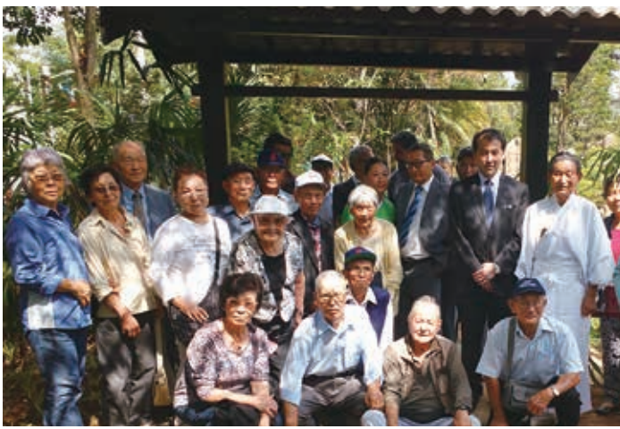
ヴァルゼングランデ在住のコチア青年が「棟門」を寄贈した

2003年、戦後移住者構成する7つの団体が戦後移住50周年式典を挙げる為に祭典委員会を組織しました。式典は州議会会場で大々的に挙行され、記念事業として日本とブラジルの友好のシンボルとして桜とイペーの植樹を行いました。その際、USPも植