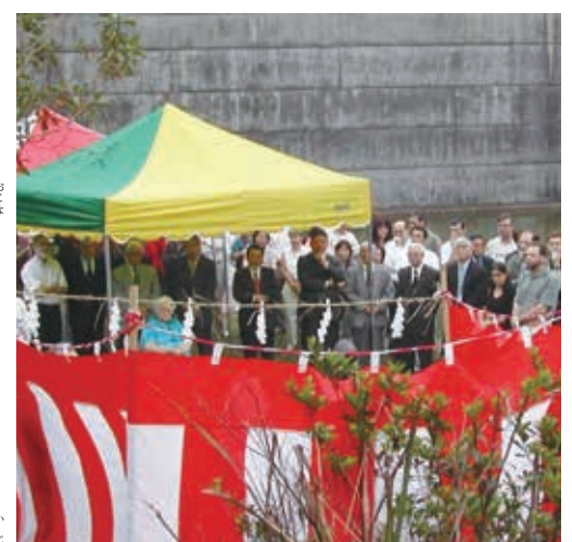
2003年の引渡し式の様子

2003年、戦後移住者構成する7つの団体が戦後移住50周年式典を挙げる為に祭典委員会を組織しました。式典は州議会会場で大々的に挙行され、記念事業として日本とブラジルの友好のシンボルとして桜とイペーの植樹を行いました。その際、USPも植