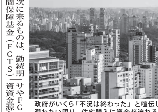
政府がいくら「不況は終わった」と喧伝しても、労働者の懐が実際に潤わない限り、住宅購入に資金が流れる事はない...

伯国貯蓄不動産信用機関協会(Abecip)によると、各金融機関では、今年から来年にかけて、一般消費者が住宅を購入する資金を融資するための資金が1千億レアル以上、借り手がつかずに余りそうだと18日付エスタード紙が報じた。昨年未だから今年初めまでは、「16年で大型不況に一区切りが着き、17年で回復基調に乗り始めたため、18