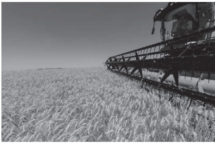
ブラジルは農業大国だが、農地拡大による森林伐採の問題も存在する