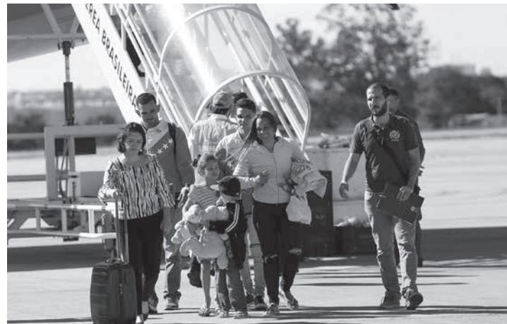
ブラジリアの空港に降り立ったベネズエラ人移民達

け入れは初めてで、子供がいる家族が優先的に選ばれた。収容先はアウデイアス・インファンチスSOS(子供保護区SOS)の意で「アウベルト・ペトラーメ」社会開発相やエリゼウ・バジャーリャ官房長官、グスターウ・ロッシヤ人権局長官も出向いて、子供20人を含む50人の移民達を迎えた。聖市には自身の男性や女性、子持ちの女性、家族が移送され、カーザ・ド・ミグランテ・ミッシン・パス(平和のミッシン移住者の家)に収容された。ロライマ州から移送される事に同意した移民達全員、予防接種と健康診断を受けたり、納税者番号証や労働手帳も支給されている。また、各自治体は、政府関係者と事前に話し合い、保健衛生面での対応や子供の入学手続き、ポルトガル語教育、職能教育に関する詳細について了解した上で、移民の受け入れを決めている。ベ国人移民の国内移送