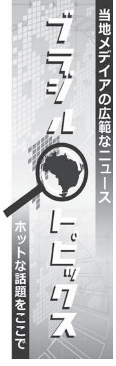
当地メディアの広範なニュース