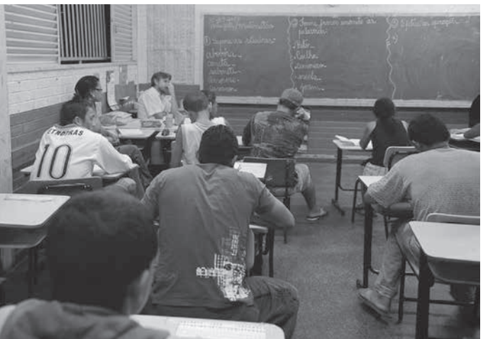
ブラジルの教育を担う教師たちの職場環境改善は急務だ

いた。新たな調査によって、これらの改善のために行わなくてはならない事が山積している事が分かった」と語っている。教師たちは、「教師と教師の価値を高めるために何かが必要か」との質問(複数回答可)に、教師に継続的な成長の機会を提供する事(69%)、教育政策立案の際に現場の教師の声を尊重される事(67%)、教師の権威と尊厳が早急に回復される事(64%)、給与増額(62%)などと答えた。ノゲイラ・フィリョ氏は、「教師は全て、給与が安いことを不満に思っている」と考えている。回答者の3分の2は女性、平均年齢は43歳で、平均して17年、教壇に立っている。(7月30日付アジェンシアブラジル、G1サイトより、8月1日掲載)