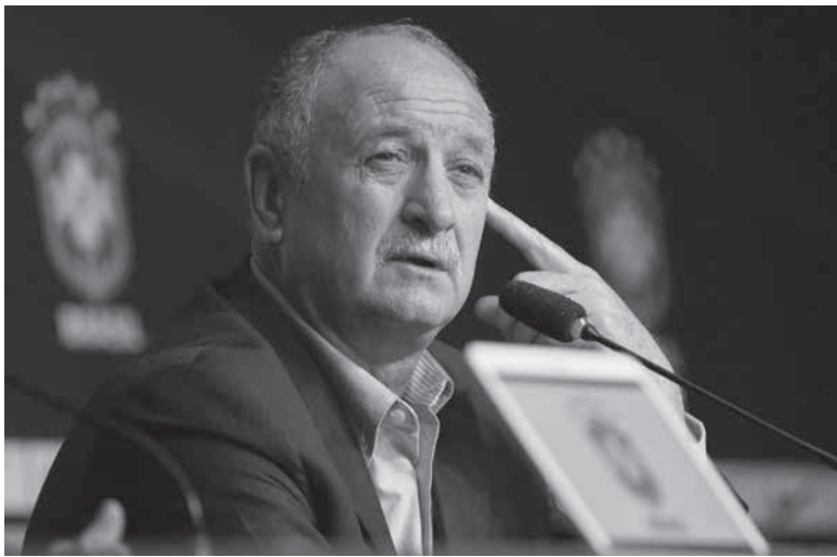
スコラーリ氏

W杯優勝監督、3度目の指揮 聖市に本拠を置く名門サッカーチーム、パルメイラスは7月26日、前任のロジェール・マシヤド監督の後任として、2002年日韓W杯優勝などの輝かしい実績を持つ、「フェリポ」ことルイス・フェリペ・スコラーリ監督が就任すると発表した。