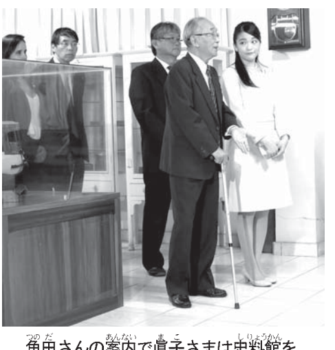
角田さんの案内で真子さまは史料館を視察された

真子さまは、先没者慰霊碑、史料館ご訪問。トメアスーで日系人と交流。 真子さまは、先没者慰霊碑、史料館ご訪問。トメアスーで日系人と交流。 真子さまは、先没者慰霊碑、史料館ご訪問。トメアスーで日系人と交流。