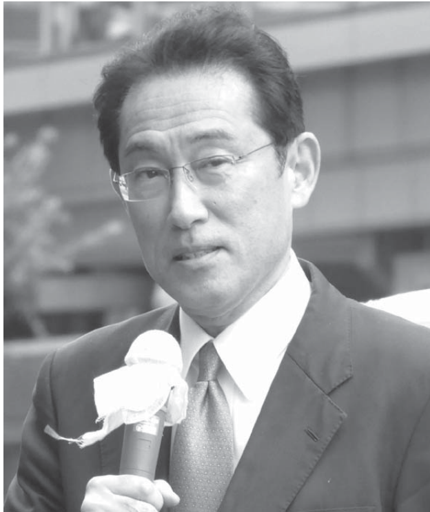
岸田文雄元外務大臣

岸田さんは、安倍総裁の「反日統一共同戦線」を無力化させていく過程を、外相としてずっと見てきたし、深くかかわってきた。