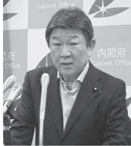
閣議後に記者会見する茂木経済再生相=3日午前、東京都千代田区

【共同】茂木敏充経済再生担当相は3日、2018年度の年次経済財政報告(経済財政白書)を閣議で提出した。12年末から約5年半に及ぶ景気回復は「戦後最長に迫る」と評価し、持続に向け、経済の実力を示す「潜在成長率」の引き上げが課題だとした。経済成長の制約となる人手不足の悪影響が一部の産業で表れていると警戒し、社会人教育や技術革新による生産性向上が重要だと説いた。