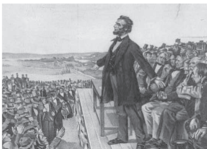
リンカーン大統領

もう一つ、南部の歴史が日本と似ている点がある。南部という日本人はすぐ黒人差別を連想する人もいるが、実はそう単純な話ではない。 映画『風とともにも去りぬ』では白人の富豪の子供達が、黒人の太ったメイドによくなついている場面も出てくる。イギリスの貴族が労働者階級を召使いやメイドとして使っていたように、南部の富豪も黒人を使っていた。階級や人種の差別はあったが、それを超えた家族的なつながりも相当程度あったようだ。 そういう南部の風土が南北戦争敗戦とともに「風」とも去つてしまひ、人種平等の掛け声とともに、逆に白人と黒人の間の距離が開き、家族的な親近感も失せて、人種対立が先鋭化していったよう