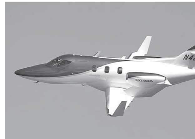
デモ飛行するホンダジェット (オシヨコシユ, 2005年)

乗越えたのか。本田宗一郎が生産の夢として参入を宣言してから半世紀。二輪車メーカーとして出発したホンダがジェット機参入という壮大な野望を実現させた過程をひもとく。青山の本社から「金食い虫」と陰口をたたかれながらも、ついにホンダジェットを創り上げた若