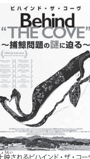
上映されるビハインド・ザ・コーブ

本南極海鯨類捕獲調査が国際捕鯨取締条約に違反しているという国際司法裁判所に提訴。日本は敗訴し、調査捕鯨見直しを余儀なくされた。イルカの追い込み漁が解禁される毎年9月から地元漁師たちに対する