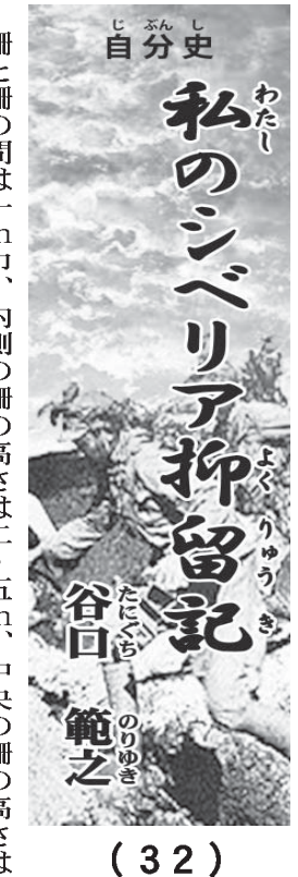
私のシベリア抑留記

【島野】もう絶対無理で... 【深沢】大学に行くこと... 【島野】ふーん、どうな... 【深沢】うーん、どうな... 【島野】そうなんだ、そ... 【深沢】そんなに苦勞な... 【島野】結構、雑じゃな... 【深沢】例えは？ 【島野】あ、O型なん... 【深沢】あ、基本は大... 【島野】普通に大学入... 【深沢】普通に大学入... 【島野】そうです。