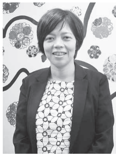
来社した八木監督

2010年、和歌山県太地町でのイルカ漁を題材にしたドキュメンタリー映画作品『ザ・コーブ』がアカデミー賞を受賞したのをきっかけに、国際問題として注目されるようになった捕鯨問題。オーストラリアは14年に日