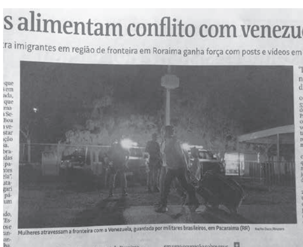
パカライマから入国するベネズエラ人たち

ロライマ州では難民急増に伴う犯罪増加などもソナロ氏の支持率が圧倒的に高い。20日発表の