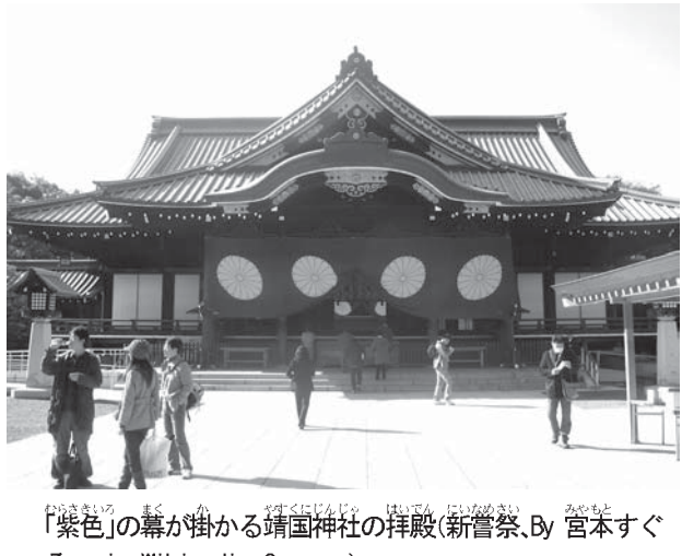
「紫色」の幕が掛かる靖国神社の拝殿(新嘗祭、By 宮本すぐる, via Wikimedia Commons)

「日本は恐ろしい」とは、枕を高くして眠れない。私、枕を高くして眠れない。戦争の時、韓国を侵略したではないか。なぜ中国に抗議しないか。という意