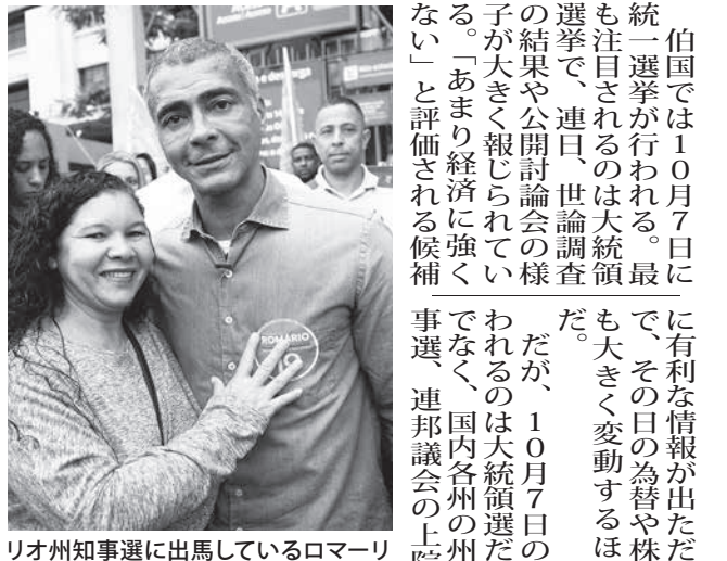
リオ州知事選に出馬しているロマーリオ候補

伯国では10月7日に統一選挙が行われる。最も注目されるのは大統領選挙で、連日、世論調査の結果や公開討論会の様子が大きく報じられている。「あまり経済に強くない」と評価される候補も、その日の為替や株価も大きく変動するほどだ。だが、10月7日の行われるのは大統領選だけでなく、国内各州の州知事選、連邦議会の上院