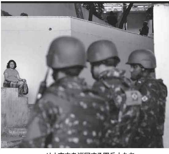
リオ市内を巡回する軍兵士たち

掃討作戦で初の兵士の死記録 この結果は、20、21日にリオ州で16歳以上の市民542人を対象に行われた「タッタフォーリア」の調査結果で判明した。それによると、「リオの治安維持のための軍投入を支持する」と答えた人は66%だった。依然として3分の2の人が、治安維持のための軍兵士の働きを支持している。だが、昨年10月に調査した際は83%から10%ポイント落ちたことになる。