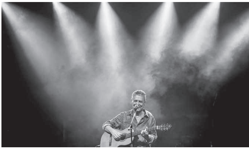
シコ・ブアルキ

「伯国音楽賞(プレミオ・ムジカ・ブラジレイラ)」の授賞式が15日に行われ、シコ・ブアルキが大賞を受賞した。伯国音楽賞は、伯人アーティストの音楽賞として、ムウチショウ賞を迎える。