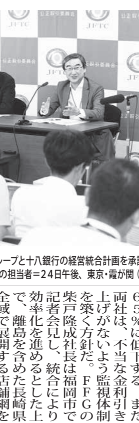
福岡地方金融センターと十八銀行の経営統合承認を承認したと発表する公正取引委員会の担当者=24日午後、東京・霞が関(共同)

【共同】公正取引委員会は24日、福岡地方金融センター(FFC)と長崎県地盤の十八銀行の経営統合計画を承認したと発表した。統合後の中小企業向け県内シェアは約65%と高水準だが、公取委は公正な競争環境が維持されることと判断した。地方銀行の経営環境が厳しさを増す中、今回の水準が