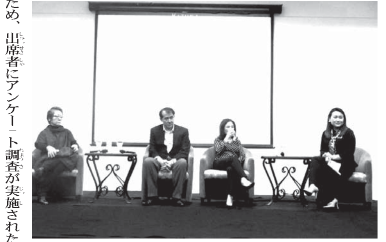
リンスで開催された