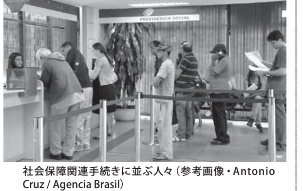
社会保障関連手続きに並ぶ人々

給者の中には受給開始後に後遺症が残った人が、自分で働けなくなった人が、増える対象になりうる。増額を求めると、25%は膨大だと語っている。同会長は、23日だけでSTJの決定に関する質問の電話を5件も受けたという。