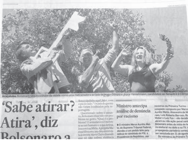
アラサトゥーバ市でもらった名誉市民のカギを機関銃に見立てて、撃つ仕草をするボウソナ氏(24日付付字紙より)

ボウソナ氏は聖州アラサトゥーバで開かれた集会で、かねてからの持論である銃所持の自由化を改めて訴えた。その際、軍警の制服を着た会場の来客の子供に、「君、銃の撃ち方知ってる？ 撃つ真似をしてごらん」と語ったが、これが後に報道され、物議を醸している。