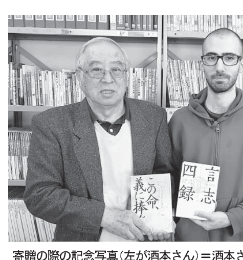
寄贈の際の記念写真(左が酒本さん)