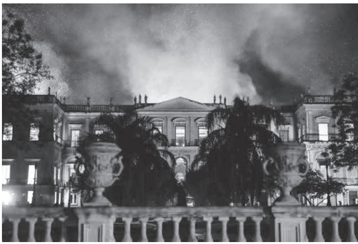
燃え盛る炎に包まれるリオの国立博物館

リオ市北部、サンクリストヴァン地区にある、ブラジル最古の自然科学機関 国立博物館で2日夜、大規模火災が発生し、2千万点以上の所蔵品の大部分が炎に包まれたと、23日付付紙紙・ニュースサイトが報じた。3日付付紙紙・ニュースサイトによると、火災発生後、火災写真を見出しにメデアも複数あった。