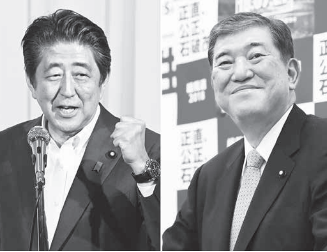
安倍首相（左）と石破氏（右）（共同）

【共同】自民党総裁選（7日告示）20日投票開票で連続3選を目指す安倍晋三首相（総裁）の陣営は3日、選対本部の発足式を東京都内のホテルで開き、国会議員230人が出席した。秘書ら代理出席を含めると346人となり、党所属国会議員405人の約85%を占めた。対決する石破茂元幹事長の支持議員が開催した同日の選対会合には議員18人が出席。石破氏は西日本豪雨に遭った岡山県を視察し、持論とする防災省設置を訴えた。