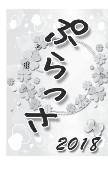
おすすめの表紙