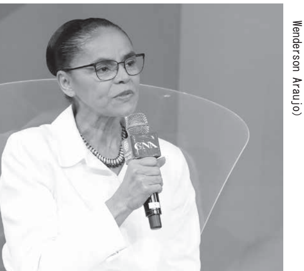
マリナ・シルバ (Rede) 候補

★「ボルソナロ」PT (労働者党) の支持率を下げ、PTの独走を許して来ましたが、党内の支援を固めて堂々の出陣です。