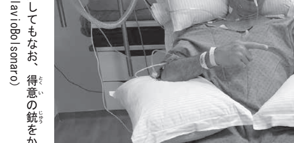
暴漢に腹を刺されて入院してもなお、得意の銃をかまえるボーイズをするジャイル・ボルソナロ (PSJ) 候補

★「ボルソナロ」PT (労働者党) の支持率を下げ、PTの独走を許して来ましたが、党内の支援を固めて堂々の出陣です。