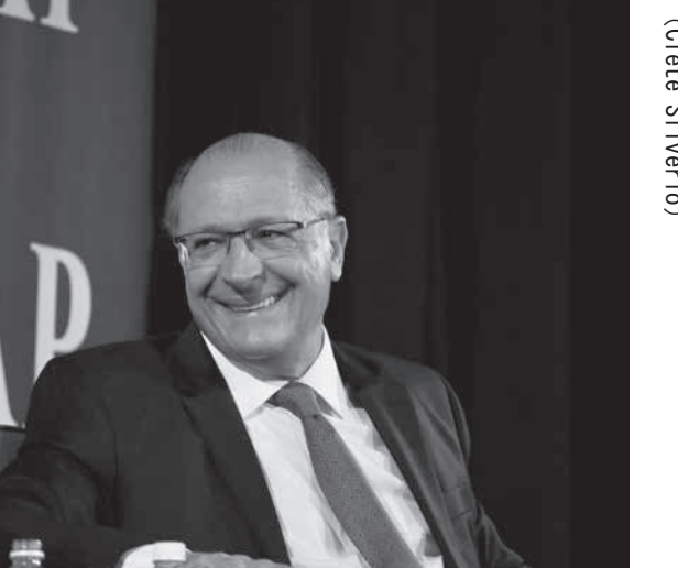
ジエラルド・アルキミン (PSDB) 候補