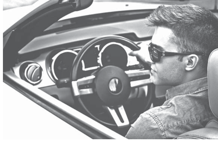
車を運転する男性

8月下旬、所用で訪問したウィーンのこと。オーストリア・ウィーンといえば、昔から伝統的に、ゲルマン系、スラブ系、マジヤール系(モロゴル系ハンガリー系)、ラテン系の多様な民族を擁する都市として栄え、今日も石油輸出機構(OPEC)、国際原子力機関(IAEA)、国連ウィーン本部など国際的な主要機関が集まる大都市である。ウィーンの旧市街地には元ハプスブルグ皇室御用達や世界の最高級品を扱う店が立ち並んでいるが、「あんなに高い物を扱う人がいるのですね」と土産物の店主に聞くと、「アラブの大金持ち一族が顧客だからね。観光客相手は自分たちからいものだよ」と言う。一夫多妻のアラブの金