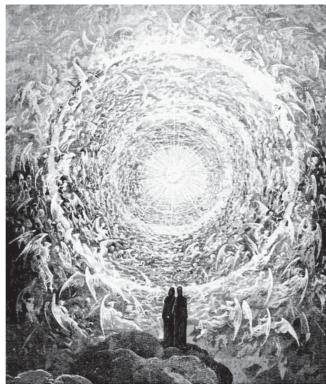
ダンテの『神曲』。地獄の最下層から旅をし、煉獄、天国へと昇ってゆく物語をドレが描いた挿画(Gustave Dore[Public domain], via Wikimedia Commons)

持ちは、妻の一人が高級ブランドの時計を買ったら、それと同等の高級品を他の妻や子供にまで平等に買い与えなければならぬそうだ。因みに土産物の店主はハンガリー系移民だという。「いろいろあるけど、祖国よりはましだからね」とつぶやいた。時期的に至るが観光客で溢れている。土産屋はもとより、空港や観光地には、チョコやスロバキアの観光バス会社派遣の運転手、タクシードライバー、飲食施設では手、宿舎、飲食施設ではシリア、アフリカ、イタリア、スペイン系、ブラジル人、そして買物好きの日本人客のために日本の若者も免税売店で多数働いている。現在「難民受け入れ」はEUの深刻な問題であるが、低賃金労働者の分