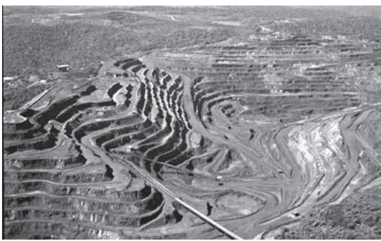
パレのカラジヤス鉱山

え、こうした要素が、市場で特定の鉄鉱石の相場の重要な役割の心とつなっている、というのがパレの認識だ。こうした様々な要素を考慮し、複数の投資銀行が、鉄含有量62%で中国市場においてスポット販売される鉄鉱石の相場が、2018年に平均で