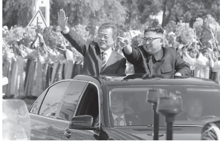
平壤市内をパレードする韓国の文在寅大統領（左）と北朝鮮の金正恩朝鮮労働党委員長＝18日

【ソウル共同】上嶋茂太 韓国の文在寅大統領は18日、専用機で北朝鮮の首都平壤を訪問し、金正恩朝鮮労働党委員長と党本部庁舎で2時間にわたる首脳会談を行った。両首脳は今年に入り3回目、金正恩氏は6月の米朝首脳会談を歴史的と評価した上で「今後、朝米の間で継続して進展があり得る」と語り、米朝関係の進展に期待を表明した。