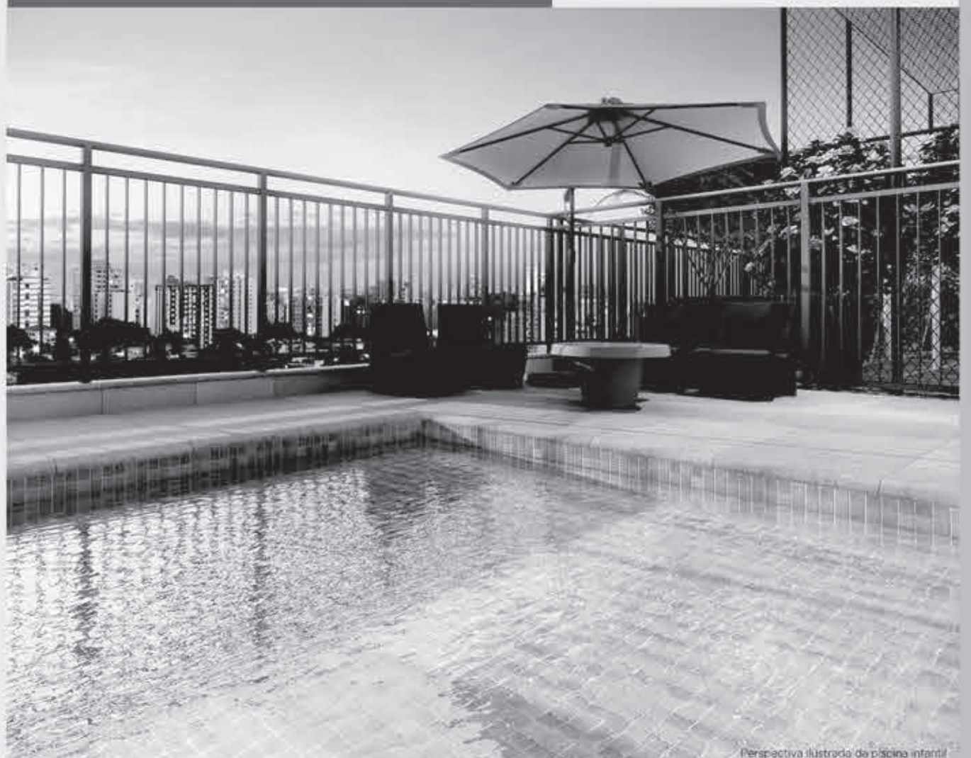
Perspectiva ilustrada da piscina infantil