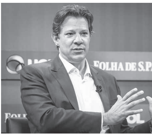
17日のハダジ氏

イボツピが18日付で発表した世論調査は16日と18日に行われたもので、ボウソナロ氏が引き続き1位だった。しかし、2%ポイント上がったボウソナロ氏がリードしている。11日に正式にルーラ元大統領から候補交代となったハダジ氏の支持率は19%。前回調査の8%から一気に11%ポイントも上がった。2位グループから抜け出した。3位に落ちたシロ・ゴメス氏（民主労働党・PDT）は支持率が11%で横ばい。1日からの政見放送開始後は支持率を9%まであげていたジェラウド・アウキミン氏（社会民主党・PSD）は7%に低下して4