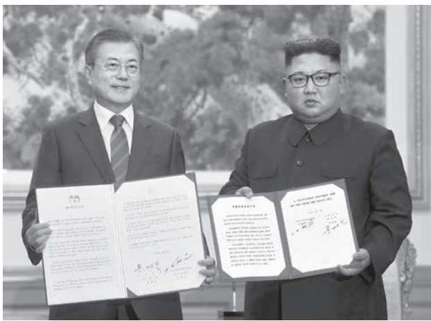
平壤の百花園迎賓館で首脳会談後、署名した「9月平壤共同宣言」を見せる韓国文在寅大統領（左）と北朝鮮の金正恩朝鮮労働党委員長＝19日

ソウル共同＝井上智太郎、上嶋茂太 北朝鮮の金正恩朝鮮労働党委員長と韓国文在寅大統領は19日、平壤で2日目の首脳会談を行い、合意文書「9月平壤共同宣言」に署名した。金氏は米国による「相応の措置」を条件に北西部寧辺の核施設を永久廃棄する用意があると表明。早期のソウル訪問も約束した。トランプ米大統領は19日、記者団に「素晴らしい進展」があったと述べ、歓迎した。膠着していた非核化を巡る米朝交渉が再開する公算は大きい。米朝同時行動を求める北朝鮮側の姿勢は原則変わっていない。