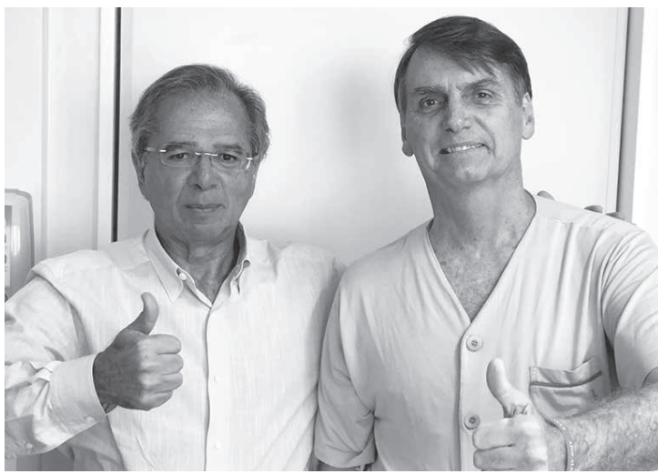
23日、ゲデス氏(左)とボウソナロ氏(@jairbolsonaro)

ボウソナロ氏は現時点での世論調査では支持率1位ではあるが、このところ、アンチ運動が激化している。