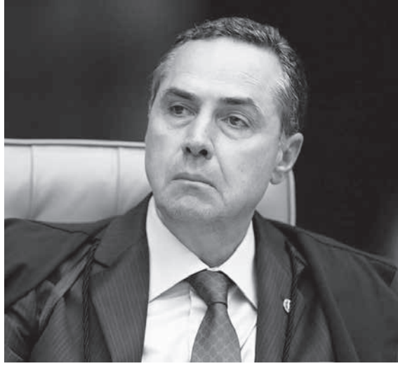
ハローソ判事

選挙人登録の定期更新を怠った有権者340万人の今年の選挙での投票権に関する審理が行われ、判事投票7対2で認めないことが決まった。選挙人登録が抹消された有権者は全有権者の2.4%ではあるが、北東部に多く、同様に強いフェルナン・ド・ハダジ氏(労働者党・PT)には不利な判断となりそう。27日付の判決が報じられている。