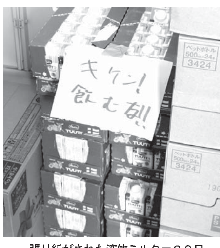
張り紙がされた液体ミルク=23日、北海道安平町

【共同】北海道の地震で、支援の乳児用液体ミルク計1050本が届けられた。乳児用液体ミルクは「なじみない」と困惑する声もあがる。乳児用液体ミルクは「なじみない」と困惑する声もあがる。乳児用液体ミルクは「なじみない」と困惑する声もあがる。