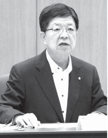
東北電力の原田宏哉社長。27日午後、仙台市記者会見する。

2号機については、引き続き安全対策を進める考えを強調した。東京電力福島第1原発事故後に策定された新規規制に基づき、原発の運転期間を原則40年とする。1号機の出力は52万4千キロワット。95年7月に運転を開始した2号機（出力82万5千キロワット）と同様、福島第1原発も採用している。 【共同】東北電力の原田宏哉社長は27日の定例記者会見で、運転を停止している女川原発1号機（宮城県女川町、石巻市）に「廃炉も選択肢の一つとして検討している」と明らかにした。同社が廃炉の可能性に言及したのは初めて。具体的な決定時期は明言しなかった。再稼働を目指す