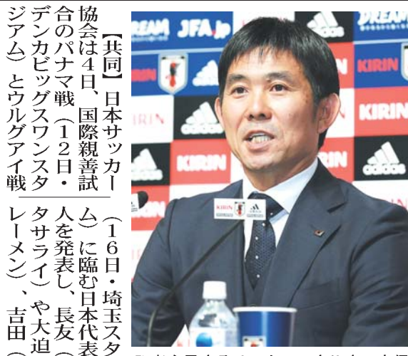
記者会見するサッカー日本代表の森保監督=4日午後、東京都文京区(共同)