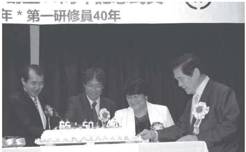
65、50、40の口ウソクを立てケーキカット

ブラジル大分県人会(四條玉田イウダ会長)は先月29日、聖市の宮城県人会館で県人会創立65周年、留學生50周年、研修員40周年記念式典を開催した。式典には安藤隆副知事、井上紳史県議会議長などの来賓7人のほか、大分県人インターナショナル会員ら7人、野口泰在聖総領事、安部順二名誉総裁(連邦下議)など約300人が参加し、盛大に節目を祝った。