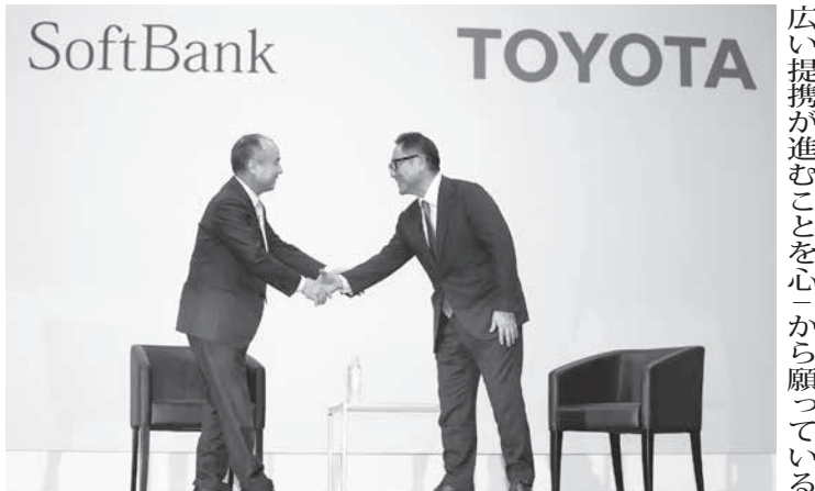
自動車の次世代技術での提携を発表し、握手するトヨタ自動車の豊田章男社長(右)とソフトバンクグループの孫正義会長兼社長=4日午後、東京都千代田区

【共同】トヨタ自動車と携帯電話大手ソフトバンクは4日、自動運転技術や通信技術の連携など、次世代車や自動運転技術の分野で戦略的提携を合意したと発表した。両社の提携は初めて。公共交通機関の少ない過疎地での配車事業や、自動運転中に車内で患者を診察したり、注文が入った料理を作りながら宅配したりする新サービスを始める。