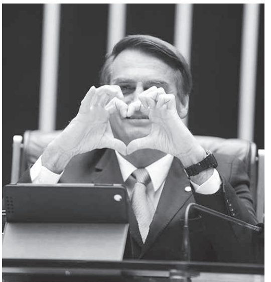
ボウソナロ氏