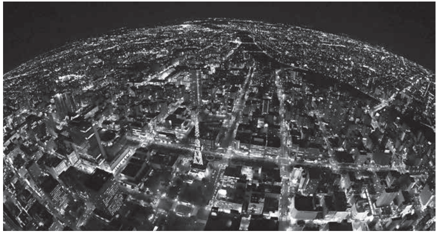
明かりが戻った札幌市の中心部。国内初の全域停電を起した北海道の地震から6日で1カ月を迎える。手前はさっぽろテレビ塔=4日夜共同通信社ヘリから、魚眼レンズ使用

【共同】国が都道府県に調査を求めている大規模地震発生時の被害想定で、北海道が項目に停電を含めていなかったことが4日、道への取材で分かった。震度7を記録し、国内初の全域停電を起した地震から6日で1カ月。北海道など6道府県が停電被害を試算せず、具体的な被害を想定していない。専門家は「停電で病院や交通機関に影響が出て被害が拡大する恐れがある。想定しなければ被災につながらず、停電発生時に大きな違いが出かねない」と指摘する。