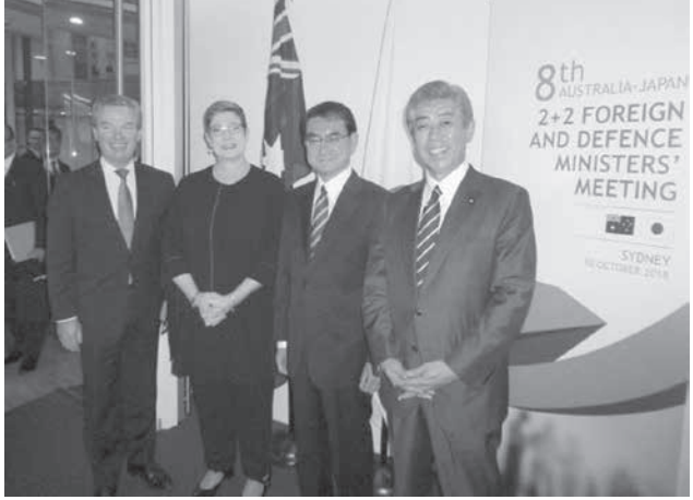
日豪外務・防衛閣僚協議に臨む（右から）岩屋防衛相、河野外相、オーストラリアのペイン外相、バイン国防相＝10日、シドニー

【シドニー共同】日本とオーストラリア両政府は10日（日本時間）、シドニーで外務・防衛閣僚協議（2プラス2）を開いた。来年中に航空自衛隊とオーストラリア空軍による初の戦闘機訓練を実施する方針で合意。北朝鮮の完全非核化実現に向け、制裁を維持する重要性で一致した。自由貿易を重視し、不正な貿易慣行に対抗することも申し合わせた。これらの内容を盛り込んだ共同声明を発表した。