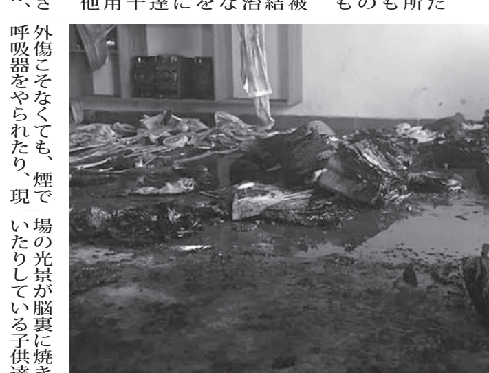
放火事件直後の保育室

ケロイドが残り、絶え間ない痛みをいまだに受けている娘のため、加湿器を1日中稼働させ、クリムや日焼け止めを繰り返し塗りこむ毎日。市役所からの支援金1千レアルは、機械を入手するために増えた電気代や、火傷治療の薬や包帯などを使用するための精神科医の診察料など、最初の1年間は被害者の家族が職員の治療費や生活費、医薬品などを確保するために力を合わせている。家族会にはこれまでに、企業家達からの支援金2万1千500レアルと、火傷の治療用品や手袋、包帯その他の品々が届けられた。