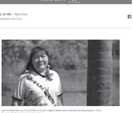
ジョエニア氏当選を伝えるG1サイトの記事の一部

北伯のロライマ州で7日に行われた統一選の下院議員選挙で、先住民女性のジョエニア・パスタ・デ・カルヴァリョ氏(通称ジョエニア・ワビシヤナ氏、43歳、REDE)が当選した。先住民女性の下院議員誕生は、190年の歴史の中でも初めてだ。