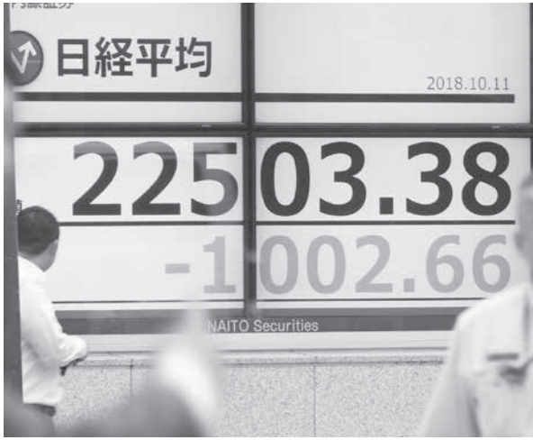
下げ幅が一時1000円を超えた日経平均株価を示すモニター=11日午後、東京都中央区(共同)

【共同】11日の東京株式市場の日経平均株価は前日の米国市場に続いて急落し、下げ幅が一時1000円を超えた。米国や中国の経済減速への懸念が高まり、アジア株も下落して世界同時株安の様相を呈した。平均株価の終値は節目の2万3000円を割り込み、約1カ月ぶりの安値水準。企業業績拡大の期待が先行して上昇傾向だった相場が変動すれば、安倍政権の経済運営にも影響しそうだ。