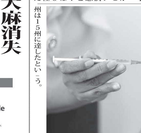
予防接種を受ける子供