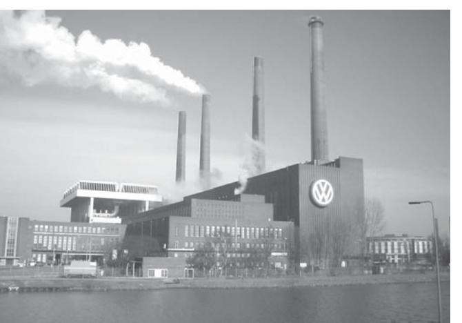
フォルクスワーゲン社の独逸ヴォルフスブルクの本社工場

VWによると、販売台数が減っているのは、米中貿易摩擦で、「消費者の間に漠然とした不透明感が生まれ、いるから」という理由で、今年と比べて、販売台数が減っている。今回と比べて、販売台数が減っている。今回と比べて、販売台数が減っている。