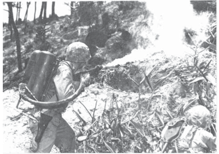
火炎放射器で洞窟の日本軍を攻撃する米兵