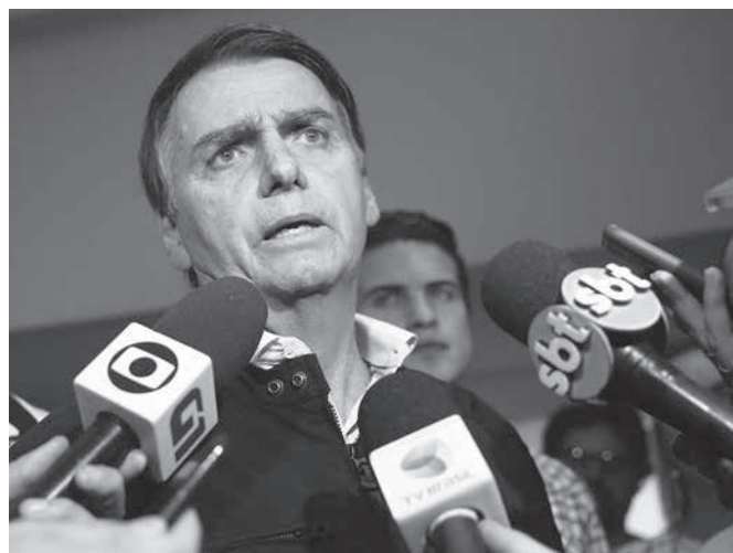
ボウソナ口氏

PSLは選挙の前に「しかいかなかったが、今回下院議員はわずか8人」の選挙で一気に52人になった。