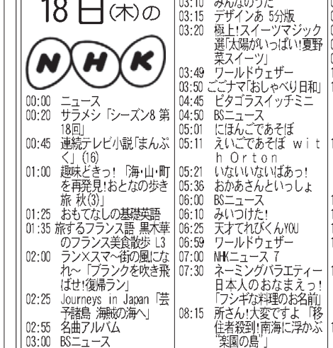
百舌鳥古墳群にある大山古墳(仁徳天皇陵)堺市

「共同」宮内庁は15日、仁徳天皇陵として管理する堺市の大山古墳に、保全整備の一環として行う発掘調査を、今月下旬から初めて堺市と共同で実施すると発表し、宮内庁は、陵墓への調査を「皇室の祖先の墓であり、静安と尊厳が必要」として厳格な制限を課している。前例のない画期的な試みだ。大山古墳は周濠の水による浸食が激しく、発掘は