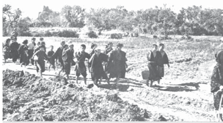
重い足を引きずって南部方面へと落ち延びる老人や子供たち

チャーという木の葉を沸騰させたお湯に浸し、僕の身体を拭いてくれました。すると不思議なことに疥癬は急速に良くなり、目のトラホーマもすっかり治りました。