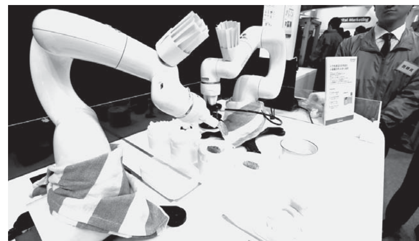
「シーテックジャパン2018」でローソンが展示している、ギョーザを作る調理ロボット=16日午前、千葉市

ローソンの未来型店舗では、お客がスマートフォンで注文した商品が自動的に調理される。テレビ電話で医師と相談したりできる。また、さまざまな機器をインターネットで結ぶ「モノのインターネット(MONET)」の展示エリアは、昨年より2倍の広さを確保している。