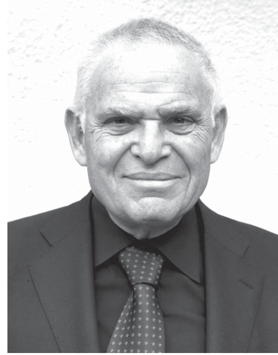
エドワード・ルトワック