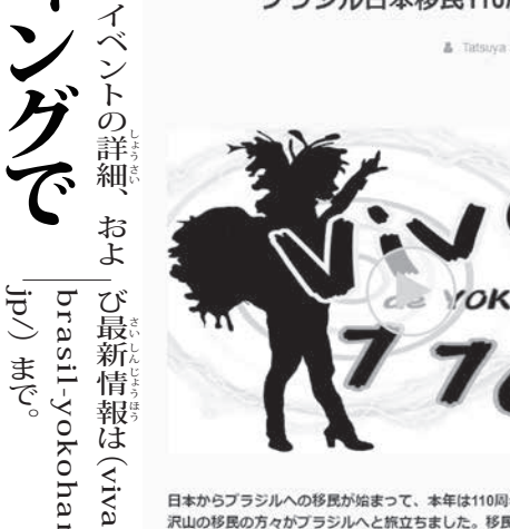
クラウドファンディングサイト内のページ

イベントの詳細、および最新情報は(vivalio.brasil-yokohama.jp)まで。