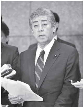
米軍普天間飛行場の名護市辺野古への対抗措置を表明する防衛相＝17日午後、防衛省

【共同】政府は17日、米軍普天間飛行場（沖縄県宜野湾市）の名護市辺野古移設を巡り、辺野古沿岸部の埋め立て承認を撤回した県への対抗措置として、行政不服審査法に基づいて国土交通相に審査を請求し、撤回の効力停止を申し立てた。