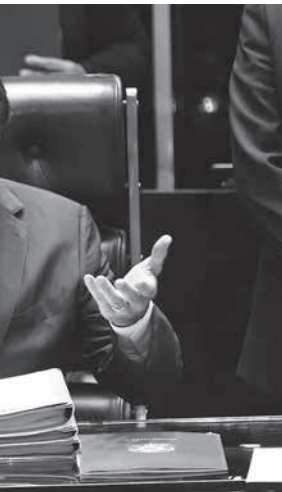
エウニシオ・オリヴェイラ上院議長

このランキングで1位に輝いたのは米国で、2位シンガポール、3位ドイツ、4位イス、5位日本と続いている。