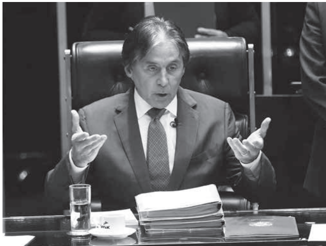
エウニシオ・オリヴェイラ上院議長

アマゾナス・エネルジ社は閉鎖される。アマゾナス・エネルジ社は閉鎖される。アマゾナス・エネルジ社は閉鎖される。