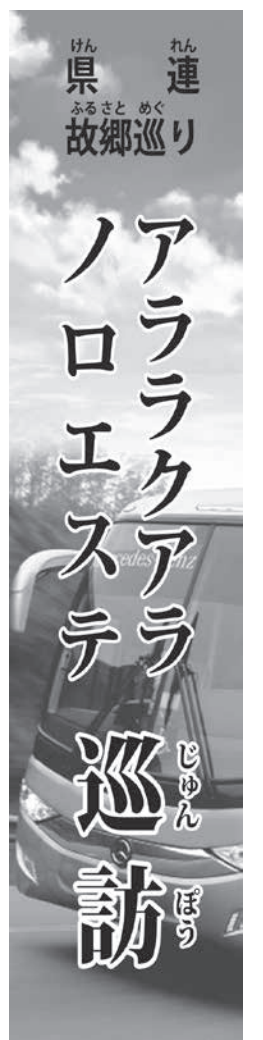
アララクアラ ノロエステ 巡訪

「組合」が創立され、その4年後に日本語学校、裁縫学校、寄宿制度が立案され、48年に実際に日本語学校が設立された。そのときにCCEIの母体である父兄会も発足。56年に奨学会の運営が父兄会に移管され、同会はイビウナ文化協会に改名された。その後81年に文協会館が落成され、2014年にイビウナ文化体育協会となった。現在は30人の生徒が在籍し、日本語を学んでいる。