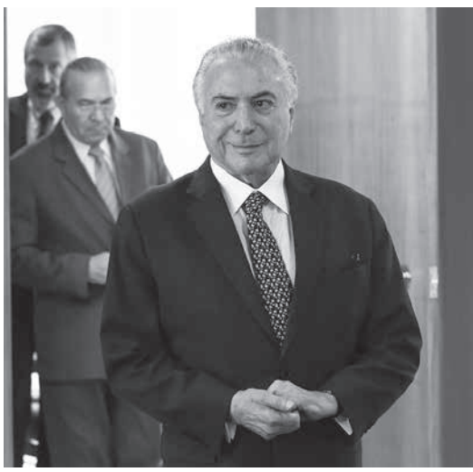
テメル大統領

告発されたのは、テメルの男」と呼ばれて話題となったロドリゴ・コロンヤ・テメラ氏、テメラ氏の元側近で昨年5月のJBSシヨック後は「カバン」