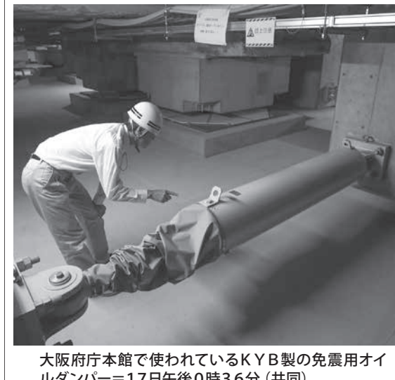
大阪府庁本館で使われているKYB製の免震用オイルダンパー＝17日午後0時36分

【共同】油圧機器メーカーのKYBと子会社がカートのKYBと子会社が地震の揺れを抑える免震・制振装置の性能検査