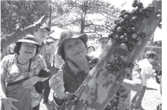
天然の木葡萄を味見する参加者