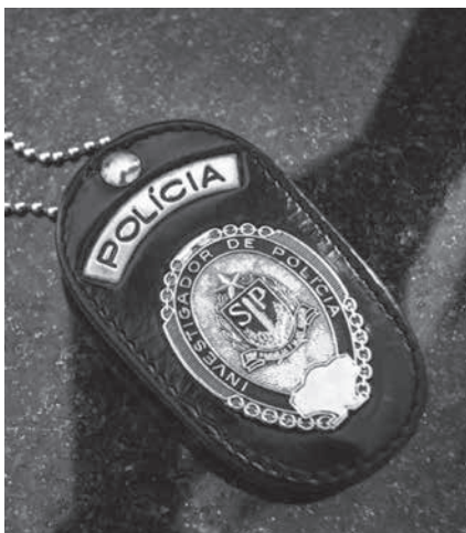
聖州市警の紋章

レアル氏は殺害した容疑もたれている。レアル氏は殺害した容疑もたれている。レアル氏は殺害した容疑もたれている。