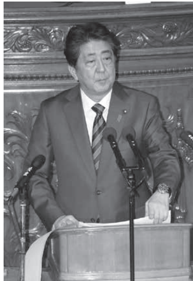
第197臨時国会で所信表明演説をする安倍首相 24日午後、衆議院本会議場（共同）

【共同】第197臨時国会が24日召集され、安倍首相は衆参両院の本会議で所信表明演説を行った。憲法改正を巡り「与野党といった政治的立場を超え、幅広い合意が得られると確信している」と述べ、改憲案の取りまとめに期待を示した。来年10月の消費税率10%への引き上げに備えた経済対策に努め、今後3年で社会保障制度を全世代型に改革すると強調。北朝鮮の完全非核化と日本人拉致問題の解決へ「あらゆるチャンスを見逃さない」と言明した。自由貿易推進への決意も表明した。