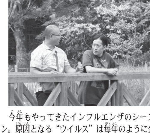
今年もやってきたインフルエンザのシーズン。原因となる“ウイルス”は毎年のように変

わっている。それはなぜ?実は今、新発見が相次いでいる“ウイルス”の世界。中にはヒトの役にたつものもいるという。ウイルス最新線を又吉が直撃!