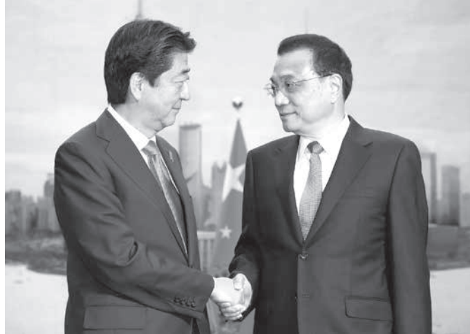
中国の李克強首相（右）と握手する安倍首相=25日、北京の人民大会堂

【北京共同】安倍首相は25日午後（日本時間）、日本の首相として約7年ぶりに中国を公式訪問した。北京の人民大会堂で開かれた日中平和友好条約の締結40周年を祝う式典であらう。26日の首脳会談に際し「新たな時代にふさわしい新たな次元の日中協力の在り方について、胸襟を開いて議論したい」と強調した。中国への政府開発援助（ODA）の終了にも言及した。