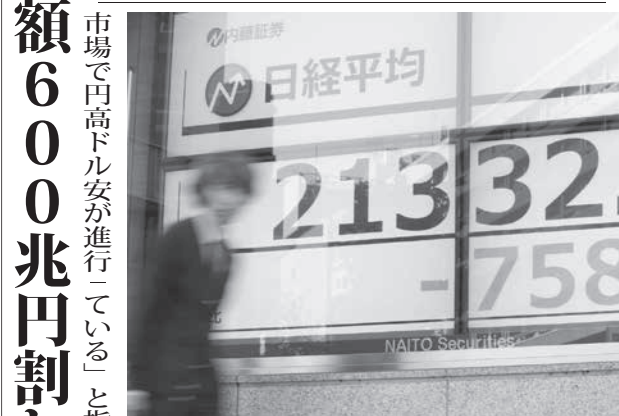
大幅反落した日経平均株価を示すボード=25日午前、東京日本橋兜町

上海や香港などの株式相場も軒並み下落。米国を震源とする株安がアジアに連鎖した。東京市場では、大企業銘柄が上場する東京証券取引所第一部の規模を表す時価総額が一時、節目の600兆円を割り込んだ。午後1時現在、前日終値比700円32銭安の2万1390円86銭。東証株価指数（TOPIX）は43.15ポイント安の1608.92。TOPIXは一時、取引時間として今年最後の安値を付けた。24日のニューヨーク株式市場で、ダウ工業株30種平均の終値は前日