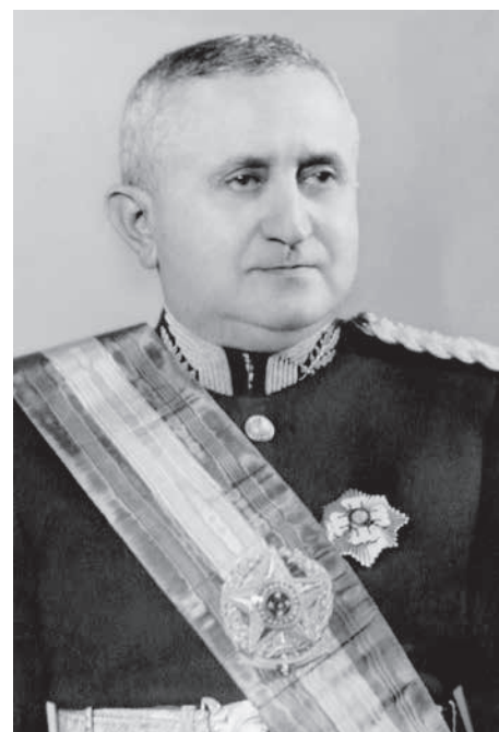
軍人ながらブラジルを民主化したトウトラ大統領

今年、リベルダーデで一番賑やかだった街頭の打ち上げ花火は、サッカーW杯ではなく、ジャイル・ボウソナロの当選だった。 半年前、支持率トップでありながらも、大半の国民からは「どうせ本命ではない」と期待を込めて思われていた人物が、最後までトップを保った。本人もクロボ局の番組ファンタスティコで選ばれるとして、「ジウマが大統領に再選した4年前、次はオレが大統領にならな」とブラジルがダメになると思った。だが周りの誰も本気にしなかった。大政党内から出馬するのは、連立政党もナシ、選挙助成金もナシ、テレビ政見放送も数秒、大メディアからは批判されつづいた。そしてみじみ語つて