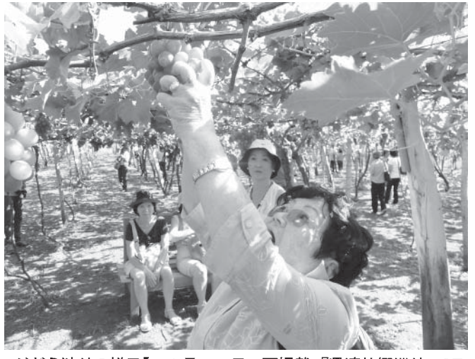
ぶどう狩りの様子【10月19日7月掲載『県連故郷巡り アララクアラ・ノロエステ巡訪 第3回より』