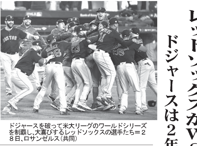
ドジャースを破って米大リーグのワールドシリーズを制覇し、大喜びするレッドソックスの選手たち。28日、ロサンゼルス

【ロサンゼルス共同】米大リーグのワールドシリーズ（WS）7回戦は28日、ロサンゼルスで第5戦が行われ、レッドソックス（ア・リーグ）がドジャース（ナ・リーグ）を5-1で破り、4勝1敗で5年ぶり9度目の制覇を果たした。ドジャースは2年連続