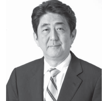
安倍晋三総理