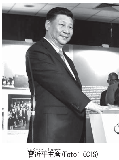
習近平主席

「中国は、中国の属国になりません！」宣言で、小沢政権は短期間で崩壊した。 「お！！」と興奮した中国は10年、「中国漁船衝突事件」を起します。 「これは全世界のメディアに公開し、ガンガン中況」が起りました。 この時、中国の高成長は止まらなかった。 08年のGDP成長率は9.6%、09年9.2%、10年10.6%、11年9.5%。 それで、世界中の人たちが「アメリカの時代は終わって、中国の時代がくる！」と思った。 日本では09年、親米自民党政権が終わり、親中民主党政権が誕生しました。 「トランプ」鳩山さんは、アメリカとの関係を破壊した。 一方、小沢さんは、北京に行き「私は人民解放軍の野戦軍司令官である！！！！！」と宣言しました。(本当の