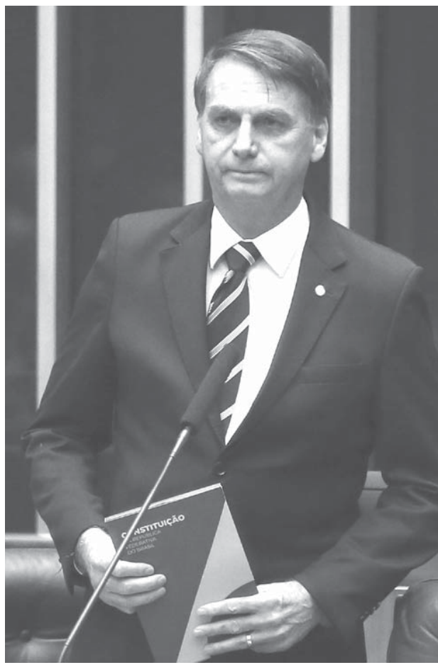
6日に連邦議会で行われた憲法制定30周年記念の慶祝議会で、憲法を手に参加したボウソナロ次期大統領候補

10月28日、大統領選挙決選投票が行われ、保守派ボウソナロ候補者が次期大統領に選ばれた。 13年間にわたるPT(労働者党)政権の腐敗と欺瞞に国民は怒り、軍政費など過激な発言をする未知数の元軍人候補者に選挙を信託した。 10月7日、第1回投票でPTハダジ候補者と無名小党PSLボウソナロ候補者の2人が決選投票に残った。10月10日付週刊誌「ヴェーエー」は、ボウソナロ候補者を「暗闇への跳躍」、ハダジ候補者を「PTの冬」と形容した。そして、両者の対決は「無差別の対決」であり、それぞれブラジル後退のリスク要因である、と解説した。 PT候補者次期大統領当選は、ブラジル社会後退のリスク要因になるとする同誌の見方は同