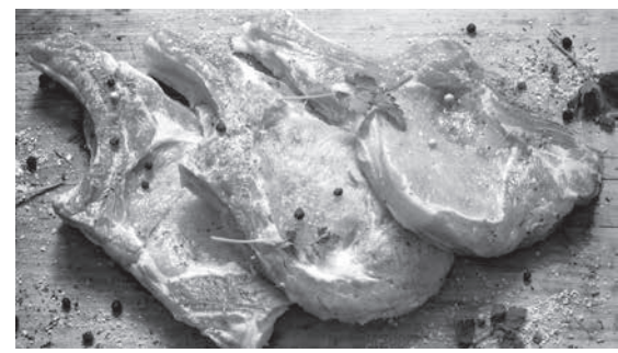
ブラジル産豚肉のイメージ

世界では、ブラジルは、こうした事態に有利なポジションを確保している、という。中国国内の衛生問題は、追いついていないと、業界関係者は受け止めている。国内の豚肉業界は、2018年上半期の飼料のトウモロコシが値上がりしたことで、供給が過剰になったこと、さらに、輸出が難しくなったことなど、様々な問題に直面してきた。9月と10月の豚肉輸出は、平均で2700トンと、前年