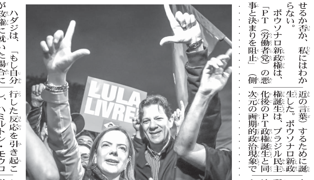
ハダジ氏(右)とグレイシ・ホフマンPT党首は、ルーラ容疑者を見舞ったあと、抗議集会に参加(18年6月29日,)

【共同】政府は6日の未来投資会議で、地方銀行や地域のバス事業者の経営統合を柔軟に認める方針を示した。独自禁止法に基づく統合審査で2業種に例外的なルールを整備し、一つの県域で市場シェア(占有率)が高くなる地域にこの方針を適用して判断する方向。人口減少に直面する地方では地銀とバスの収益悪化が目立ち、合併などの再編による経営安定を後押しする狙い。審査を担う公正取引委員会に、地銀とバスの専門部署を設けることも検討。同法改正を視野に入れた議論は、来夏にまとめる工程表で実施時期や条件が示された。統合とは異なるが、広島市で行政とバス業界が1990年代以降、路線再編などの連携を深めた。これに「不当取引制限」(カルテル)に当たる公取委が指摘し、頓挫した例もあった。 政府は具体的な示さなかったが、2業種以外で影響が大きい地域企業への救済策として、法改正を伴うかは今後詰める。借入金と運賃の上昇を招かないよう、公平性の確保が求められる。