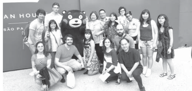
3日晩の前夜祭で記念撮影する県人の皆さん