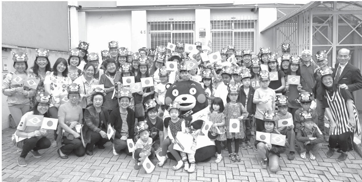
日本語センターでも集まった子供たちと記念撮影。くまモンのひざの上には子供たちが競って乗った