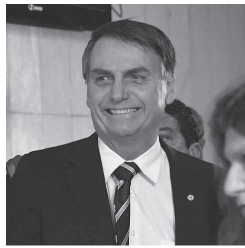
6日のボウソナロ氏

28人中、引継ぎの中核となるのは、他の27人に先駆けて官報に掲載された、官房長官予定者のオニキス・ロレンソ(文化センター(CCB))と、首相のブラジル銀行