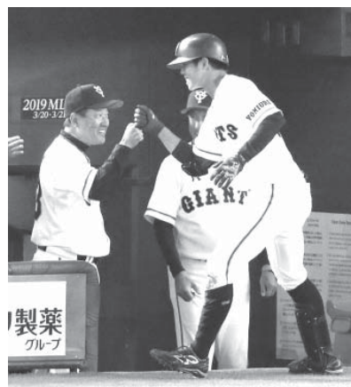
巨人の選手が打席に立つ様子。左から投手、捕手、一塁手、二塁手、三塁手、遊撃手、内野手、外野手、監督、コーチ、審判員、観客。

【共同】4年ぶりに開催される日米野球は9日に東京ドームで開幕する。米大リーグ（MLB）オールスターチームは8日、東京ドームで行われた、原監督が復帰した巨人とのエキシビションゲームに9-6で勝った。