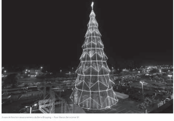
クリスマスツリーについて報じたG1サイトの記事の一部

過去最大の高さ65メートル リオ市西部のバーラ・シヨピンダに、同市では過去最大となる、高さ65メートルのクリスマスツリーが登場した。