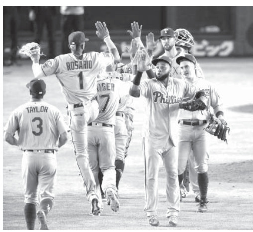
巨人に勝利し、タッチを交わすMLBナイン＝東京ドーム

【共同】4年ぶりに開催される日米野球は9日に東京ドームで開幕する。米大リーグ（MLB）オールスターチームは8日、東京ドームで行われた、原監督が復帰した巨人とのエキシビションゲームに9-6で勝った。