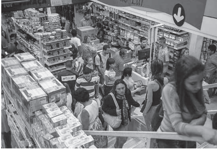
2015、16年に比べると緩やかだが、インフレ率は去年より加速している。

10月としては3年ぶりの高数値 地理統計院(IBGE)は7日、今年10月の広範囲消費者物価指数(IPCA・インフレ率)は0.45%で、10月の値としては、0.82%だった2015年以来的の高数値を記録したと発表した。