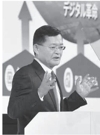
中期経営計画について記者会見する東芝の車谷暢昭会長兼CEO。8日午後、東京都内

【共同】東芝は8日、2019〜23年度の5年間の中期経営計画を発表した。グループの従業員は約1400人の早期退職などを通じて約7千人削減する。経費を圧縮し、50歳以上の従業員が多い人員構成を適正化する狙い。IT整備といった成長分野に約1兆7400億円を投資し、売却した半導体メモリー事業に代わる新規事業を育成する。