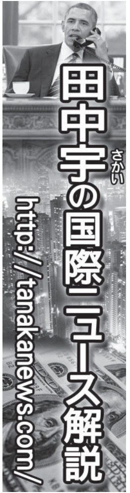
田中宇の国際ニュース解説