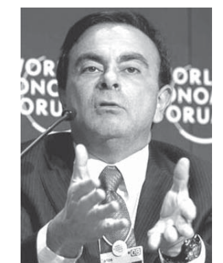
カルロス・ゴーン

で出陣し、2人でルノーの日産・三菱併合を進めようとしていることを印象づけた。これまでアジアで生産していたアジア向けの日産車をフランスで生産して、フランスで販売する計画が進んでいた。 マクロンはルノーに、自衛隊の人員削減政策の一環としての電気自動車の開発も急がせており、それも日産・三菱を巻き込んで行おうとしている。 日産と三菱の側では、ルノーに併合されることを抵抗があっただけで、今回のゴーン逮捕は、日産の西川社長らルノー系以外の幹部たちが、ルノーに食われるのを阻止するため、ゴーンの一腐敗を攻撃にたれ込んで事件化したことになっている。 だが、日産が検察に頼んでやってもらった事件であるなら、検察が金融商品取引法違反だとか、司法取引だとか、異例の手段でゴーンを潰していることに説明がつかない。 今度の事件は、横領的米國がトランプになった。 米國がトランプになった。米國がトランプになった。米國がトランプになった。