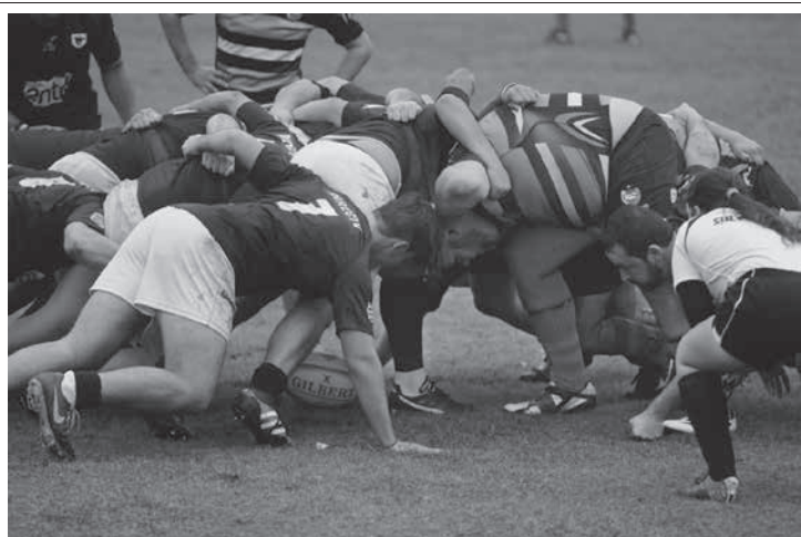
サッカーの人気には遠く及ばないが、伯国でも南部を中心にラグビーはプレーされている。

黒一色のユニフォームから「オールブラックス」の愛称で世界的に畏怖される、ラグビーのニュージーランド代表。ニュージーランドの先住民であるマオリ族出身者だけで構成され、オールブラックスのBチームとも評される、マオリ・オールブラックス(マオリAB)が10日、聖市のモルンビ競技場で伯国代表と親善試合を行い、35対3で勝利した。