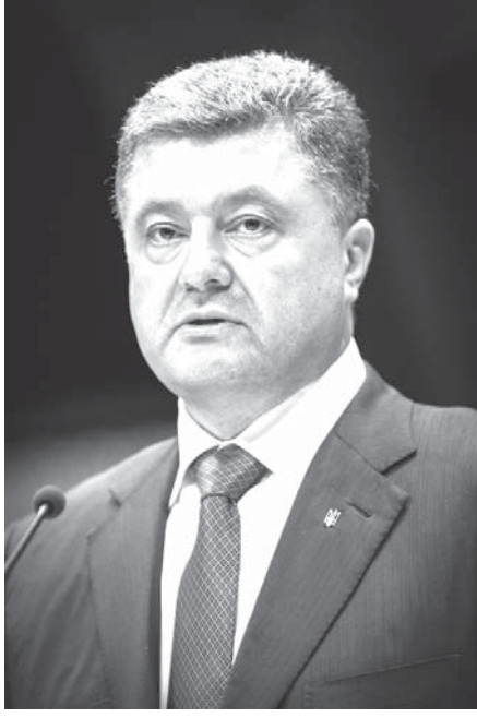
支持率低迷に悩むウクライナのポロシエンコ大統領

「『ニューヨーク時事』ロシアが併合したウクライナ南部クリミア半島周辺の黒海海域で、ロシア海軍艦隊がウクライナ海軍の艦隊に突撃し、3隻を拿捕した。」 これに対し、ウクライナは同国東部の親ロシア派武装勢力が実効支配する地域に大規模砲撃を実施。両国間の緊張が一気に高まった。 ロシアが、ウクライナの軍艦に突撃し、3隻を拿捕した。