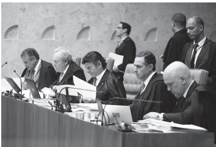
11月29日の最高裁審理の様子

連邦最高裁判廷は11月29日、テメル大統領(民主運動・MDB)が昨年未に出した「クリスマス恩赦」の合憲性を問う審理(報告官パルト・パロゾ判事)を行った。審理に参加した10人の判事中、過半数を超える6人は合憲性を認めるとし、認めなかったのは2人だけだった。だが、ルイス・フックス判事とジマス・トフォリ判事が証拠再検討を求めたので結審には至っていない。また、審理再開日程は決まっていないと、11月30日付伯字各紙が報じている。