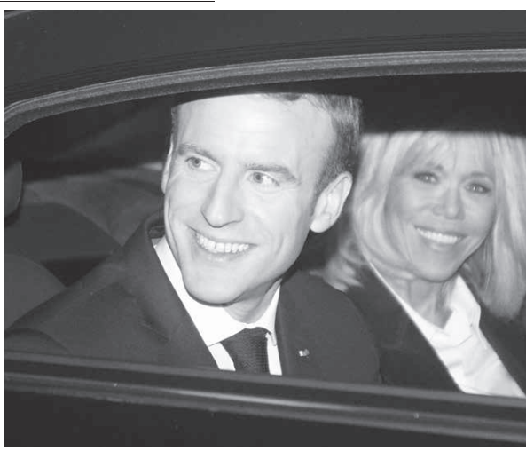
マクロン大統領 (G20 Argentina)

貿易合意に関する会見の場で、「パリで結ばれた協定に関しては世界中の責任だ。だが最近、伯国で重要な政治的変革があり、メルコスルがその影響を受けることになる」と発言した。つまり、パリ協定離脱なら、お返しに(約20年かけて交渉を重ね、締結直前のメルコスル・EU間の自