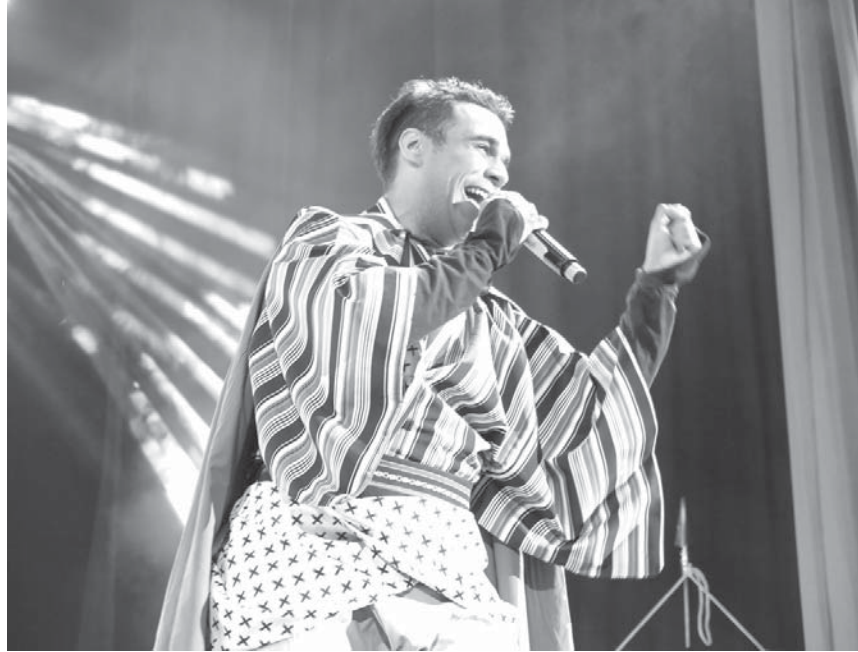
熱唱するエドアルド

「ファンになったよ。日系人でもないのに、彼の歌には日本人の心がこもっている。CDを買って練習し、これからカラオケ大会で歌いますよー」 2日、ブラジル紅白歌合戦の最後に1時間行われた、日本の演歌歌手エドアルドの特別公演に感激し、そう興奮冷めやらぬ様子で語った。