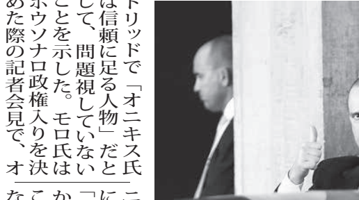
4日のオニキス氏

について尋ねられたが、「罪を認めて謝ったが、ボウソナロ政権入りを決めた際の記者会見で、オニキス氏を巡る裏金疑惑