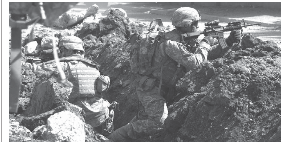
イラク戦争における米軍

早稲書評を書きます。北野さんは1970年生まれ、48歳で28年間、モスクワに住み、ロシア人の女性と結婚され、お子さんが2人います。