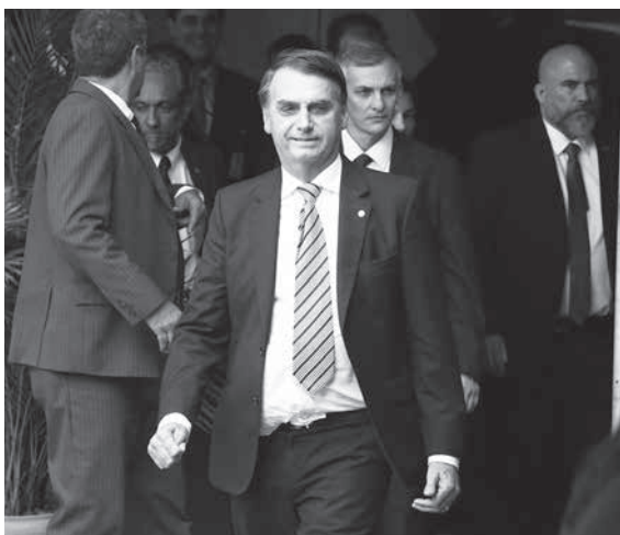
ジャイル・ボウソナロ次期大統領