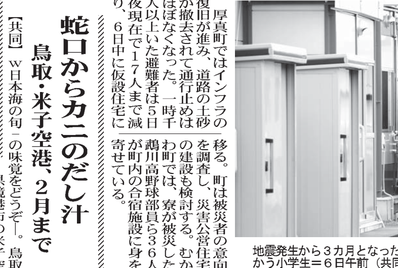
地震発生から3カ月となった北海道厚真町で、仮設住宅から学校に向かう小学生=6日午前

厚真町ではインフラの復旧が進み、道路の土砂が撤去されて通行止めはほぼなくなった。一時千人以上いた避難者は5日現在で17人まで減っている。