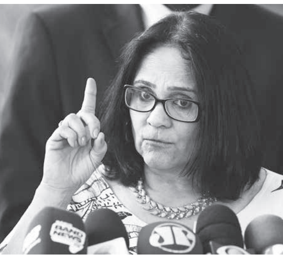
6日のダマレス氏

ボウソナロ氏は福音派の名は彼らの第一希望の名義に達するに必要だが、福音派は当初、ボウソナロ氏の副候補に名前が挙がり、ボウソナロ氏が暴漢に襲われた後に広報的な役目を果たすなど、選挙キャンペーン中もつきりだったマダノ・マウタ上議(共和党・PR)の閣僚入りを信じ、大臣枠が残り二つになっても同氏入閣の可能性を疑っていなかった。