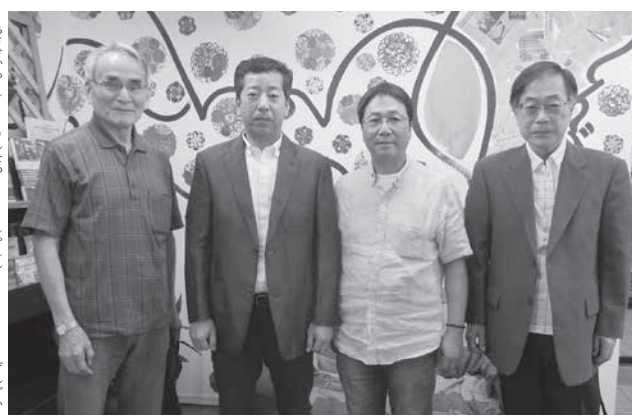
案内のため来社した一行

5年間勤務で全額返済不要に 北海道東川町で、介護留学生向けに給付型奨学金制度が始まる。2年間介護を学んだ後、5年間指定の介護施設で勤務すれば、全額返済不要となる。国籍や年齢を問わず、N2相当の日本語能力が条件。だが現在はN3、4相当であっても、奨学金を受給しながら一年程度日本語を学んだうえ、介護科に進むことができれば、町が責任を持って支援し、最長で3年間の授業料や生活費が全額免除されるという外国人にとってはメリットの多い制度だ。