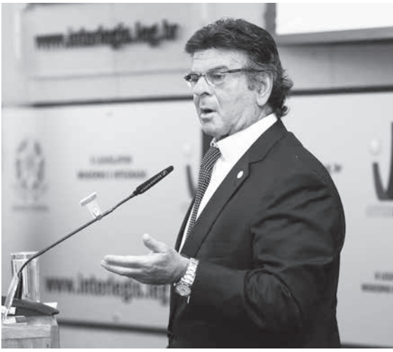
ルイス・フクス判事

連邦最高裁のルイス・フクス判事は6日、「貨物輸送の法定最低運賃を破った場合に、国家陸路輸送局(ANTT)が罰金を徴収することを認めない」という判決を出した。6日付付伯字紙が報じた。