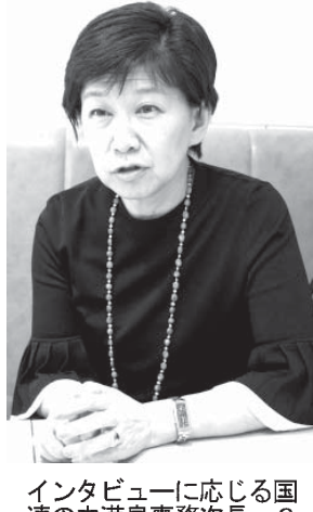
インタビューに応じる国連の中韓事務次長(6日、東京都渋谷区)

15年の前回会合は、核廃絶の方策や中東非核化の方向性を巡り加盟国が激しく対立し、最終文書をまとめられず決裂した。トランプ政権が中距離核戦力(INF)廃棄条約の破棄をロシアに最後通告し、核軍縮の先行きに国際社会が懸念を深める中、中韓氏は「会合の2回連続失敗はあり得ない」と強調した。中韓氏によると、閣僚会合では①核保有国の核軍縮義務②非保有国の核兵器製造・取得の禁止③原子力の平和利用の禁止となる「NPT3本柱」の意義を再確認し、NPTの義務を今後も履行し続ける加盟国の決意を表明する宣言採択を目指す。20年の再検討会議にむけて加盟国は既に2回開かれた。しかし中韓氏は「(会合成功)は向かい」との見え方はないという。閣僚会合を開催する