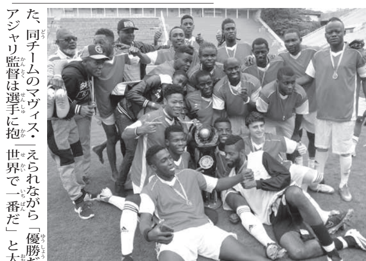
優勝した難民選抜チームのマライカ

サッカー難民 優勝はマライカ選抜チーム 関心高め、社会進出目指す 聖リオ、ポルト・アレグレ市で予選を行った。決勝には難民選抜チームのマライカ(アフリカの部族)とアンゴラチームが出場し、見事マライカが優勝を取った。同大会は2014年から開催されている。難民問題への関心を高め、難民の社会進出の促進を目的として