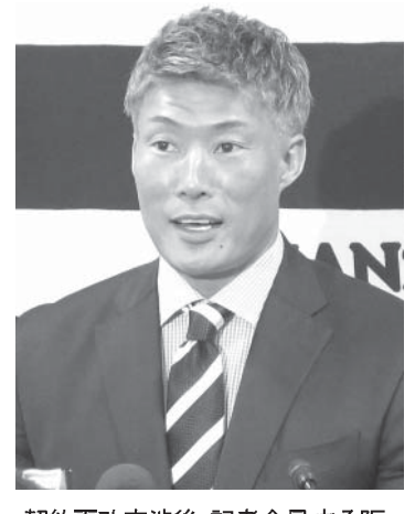
阪神の糸井嘉典

【共同】阪神の糸井嘉典監督が13日、兵庫県の西宮市の球団事務所で行った記者会見で、現状維持の現状を述べた。糸井監督は「悔しさ晴らす」と語り、現状維持の現状を述べた。糸井監督は「悔しさ晴らす」と語り、現状維持の現状を述べた。