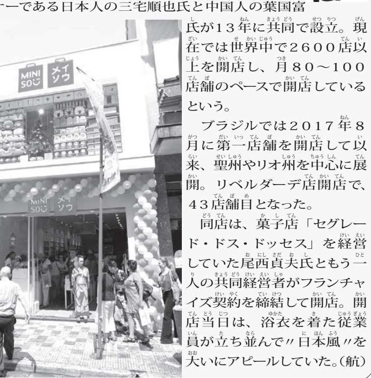
ガルボン街に開店したメイソウ。ブラジルで43店舗目

破竹の勢いで快進撃を続ける中国系資本の日用雑貨店「MINISO」(または「メイソウ」)が13日、東洋街の自抜き通りガルボン・ブエノ街13番にオープンした。「ダイソーっぽくてユニクロ風味、それでいて無印良品」と評される同店チェーンを運営するのが、株式会社「名創優品産業」(本社=中国広東省広州、本店=東京都銀座)。