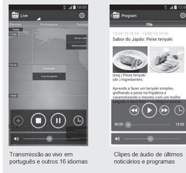
Transmissão ao vivo em português e outros 16 idiomas