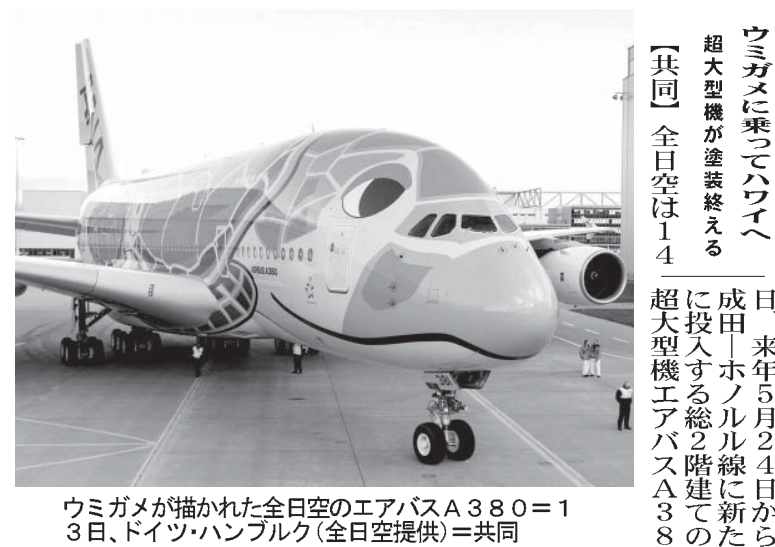
ウミガメが描かれた全日空のエアバスA380=13日、ドイツ・ハンブルク

の、国の持ち出し分を補う方策は示されず、財政再建はなおざりにされた。景気対策以外では未婚のひとり親への支援が一歩進んだが、婚姻歴で線引きする控除制度の変更に踏み込まなかった。全体として税制議論に乏しく、家族構成や働き方の変化に沿って所得税の仕組を考え直すという積年の課題は素通りだ。政府と与党は今回の改正と19年度予算案で消費増税に臨む。生活不安を解消する将来像を示さなければ消費の安定も難しく、景気の足取りはおぼつかない。