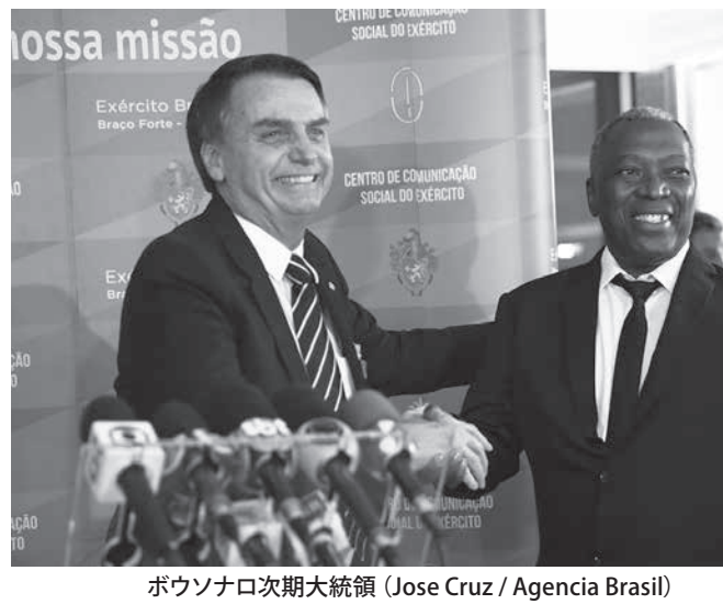
ボソナロ次期大統領

「次期政権の優先課題は何か」の問いには、「公共医療の質の改善」と「雇用創出」の答えが多く、「次期政権が直面する主要な問題は」との問いでも、二つのテーマは上位にランクされた。「次期大統領が唱えた政策で思いだすものは」との問いには、12%が「社会保障制度改革」と答え、9%が「統制緩和」、9%が「汚職撲滅」、7%が「法的責任年齢引き下げ」、7%が「蔓延する暴力の撲滅」、6%が「省庁統合、削減」を挙げた。