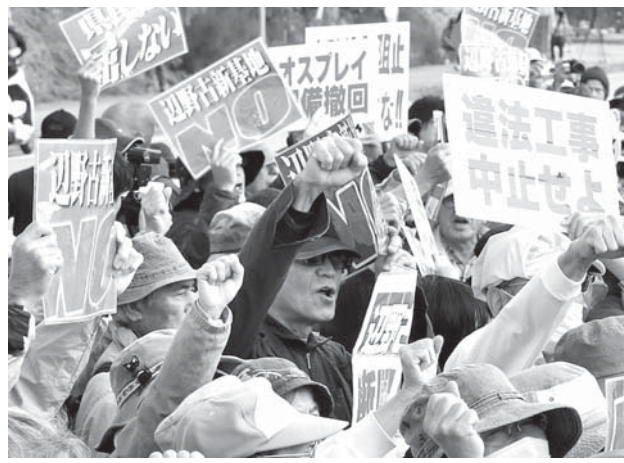
政府による辺野古沿岸部の埋め立て用土砂の投入が始まり、米軍キャンプ、シュワフのゲート前で抗議する人たち=14日午前11時1分、沖縄県名護市

【共同】灰色の護岸で囲われた青い海を封じる土砂投入が始まった。米軍普天間飛行場の沖縄県名護市辺野古移設へ、政府が重大な一歩を踏み出した14日。「美ら海を殺すな。輝きを失いつつある海を前に、翻弄される人々の怒りが渦巻いた。「沖縄の心に寄り添う」との言葉に反する政府の姿勢。南の島の分断は深まる。