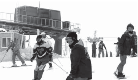
日本最南端の「五ヶ瀬ハイランドスキー場」で、スキーやスノーボードを楽しむ人たち=14日午前、宮崎県五ヶ瀬町

【共同】日本最南端のスキー場として知られる宮崎県五ヶ瀬町の「五ヶ瀬ハイランドスキー場」が14日、今季の営業を始めた。来場者数は減少傾向をたどり、一時は閉鎖も検討されたが、顧客を積極的に呼び込んで巻き返しを狙う。