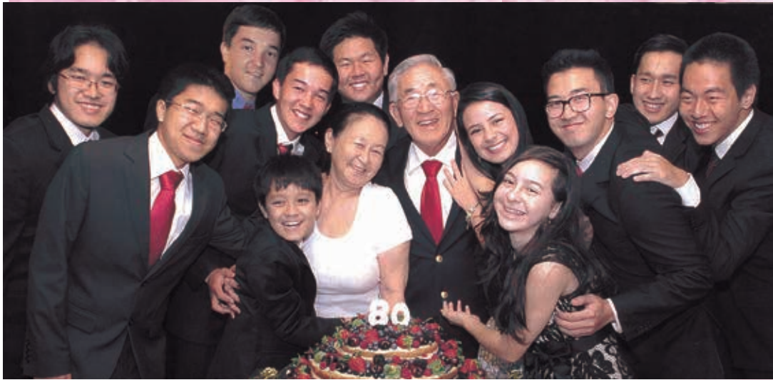
たくさんの孫らに囲まれて移住80周年を祝う様子 (伝記133P)