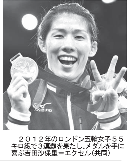
2012年のロンドン五輪女子55kg級で3連覇を果たした吉田沙保里

【共同】レスリング女子で五輪と世界選手権を合わせて16大会連続世界一に輝き、2012年に国民栄誉賞を受賞した吉田沙保里(36)が、現役引退を明らかにした。ツイッターなどに「33年間のレスリング選手生活に区切りをつけることを決断しました」と投稿し、日本レスリング協会にも引退を報告した。10日に東京都内で記者会見する。銀メダルに終わり、五輪4連覇を逃した16年リオデジャネイロ五輪後