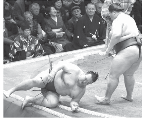
逸ノ城にはたき込みで敗れた稀勢の里=両国国技館

【共同】大相撲初場所2日目(14日・両国国技館)進退の懸かる横綱稀勢の里は平幕逸ノ城に2連敗した。昨秋場所から千秋楽から不戦敗を除いて7連敗で、1場所15日制が定着した1949年夏場所以降では貴乃花と並ぶ横綱のワースト記録となった。逸ノ城は6個目の金星獲得。横綱白鵬が栃煌山を辛くも突き落とし2連勝。横綱鶴竜は小結御嶽海に押し出され、初黒星を喫した。大関陣は高安が小結妙義龍を押し出して初金星。栃ノ心は錦土に、豪栄道は北勝富士に屈した。2連敗となった。貴景勝と玉鷲の両関脇は2連勝。脇は2連勝。無情連敗、不名誉増える。