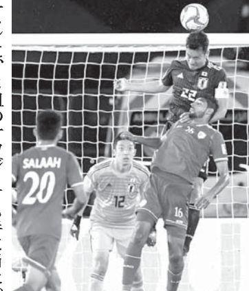
日本代表はオマーンに1-0で勝利し、決勝に進出

【共同】サッカーアジア杯オマーンに1-0で勝利し、決勝に進出した。日本代表は13日、アラブ首長国連邦(UAE)のラフドビヤドで1次リーグ第2戦が行われ、2大会ぶりの5度目の優勝を狙うF組の日本はオマーンを1-0で下した。2連勝の勝ち点6で、1試合を