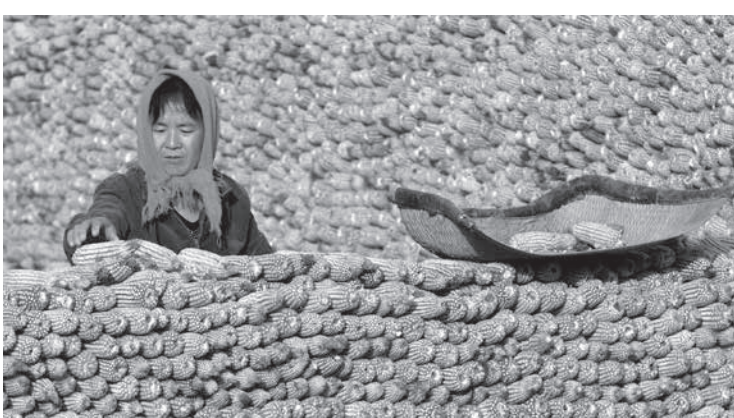
中国のトウモロコシ畑

トウモロコシの国内備蓄が減少していることから、中国は今後3年、輸入を拡大する必要性に迫られる見込みだ。 追加需要の恩恵を受けるか