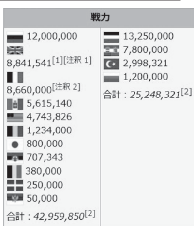
第1次世界大戦のときの戦力差。左側がイギリス側、右がドイツ側。