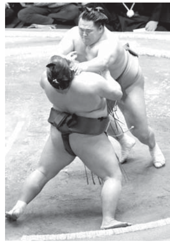
玉鷲(奥)が押し出しで錦木を破る一両国技館

【共同】大相撲初場所 10日目(22日)両国国技館。2場所ぶり42度目の優勝を狙う一人横綱の白鵬が平幕隠岐の海を寄り切り、10戦全勝で単独首位を堅持した。ただ一人1敗だった千代の国が敗れたため、白鵬は後続と2差の独走態勢に入った。 両大関はともに白星。高安は関脇貴景勝をはたき込んで星を五分に戻した。貴景勝は3敗目。豪傑は琴奨菊を外掛けで下して、4勝目を挙げた。関脇玉鷲が錦木を押し出して勝利した。