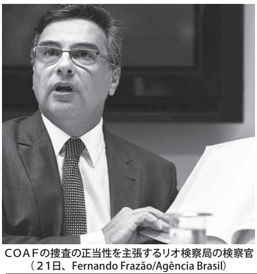
COAFの捜査の正当性を主張するリオ検察局の検察官(21日、)