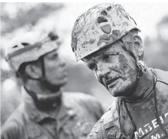
州が「触ってはいけない」と呼びかける泥に全身まみれて救助活動を行う消防隊

【既報関連】1月31日、ミナス州ブルマジーニョの鉱滓ダム決壊事故から1週間が経過した。同日夜の段階で確認された死者の数は100人を超え、行方不明者238人の生存も絶望視されていると、1日付付字紙が報じた。