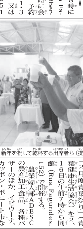
新年を祝って乾杯する出席者ら

「日本文化は奥深い。先生の話は本当に素晴らしい」と心打たれた様子だった。28日には、こどもの日。世界11カ国で「日本文化は奥深い。先生の話は本当に素晴らしい」と心打たれた様子だった。