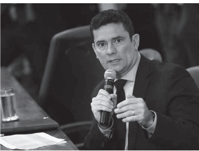
セルジオ・モロ法相

ポソナロ新政権の主要課題の一つ、「汚職撲滅、治安改善」を託されたセルジオ・モロ法相は4日、「犯罪防止法案」を発表した。5日付の新聞に掲載された。法案には、組織犯罪、汚職、暴力犯罪に対抗する14の法改正が含まれている。