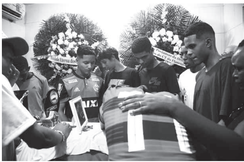
棺の前で泣き崩れる犠牲者の同僚たち

8日未明にリオ西部バールセン・グランデにあるサッカークラブ「フラメンゴ」のトレーニング・センター通称「ニニョ・ド・ウルブ」(コンドルの巣の意)の少年用宿泊施設で起こった火災で、プロ予備軍の10人(14・17歳)が死んだ件に関して詳細が続々と出てきている。フラメンゴ側の消防法を無視した運営が問題の根底にあったという。9、10日付付字紙が報じている。