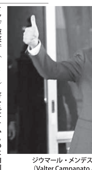
ジウマール・メンデス最高裁判事

まず、本人と肉親が経営する企業で、これまでコンブレ氏には2014年の上院議員選挙のときに3つの捜査疑惑を持たれていた。