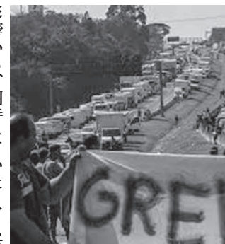
2018年のトラック・ストの様子

景気が緩やかに回復しているものの、スーパーマーケット及びハイパーマーケットの売上は2018年、金額ベースで前年比12.9%増、数量ベースでは同12.8%増を記録した。