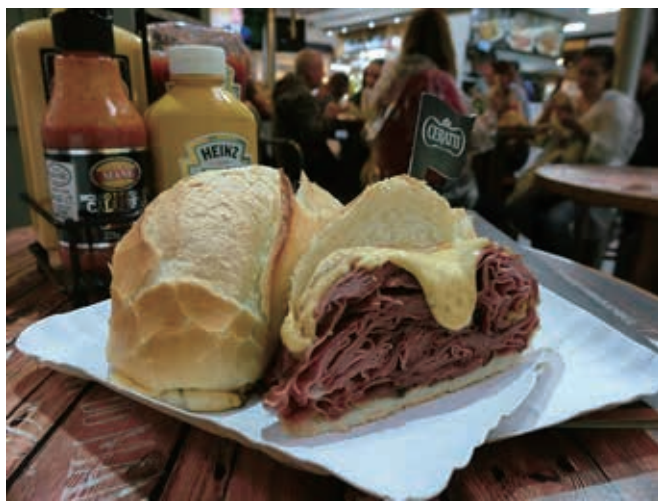
肉々しいボリューム満点のモルタデッラのサンドイッチ

聖市営市場(メルカド)設立とともに、暖かな雰囲気を上げた昭和8年創業のサンドイッチ屋「バール・ド・マネ」(Bar do