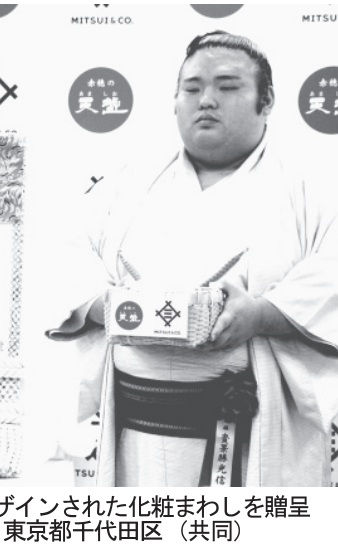
贈呈された化粧まわしをデザインした塩のマーク「天塩」の各種「天塩」のマークがデザインされた化粧まわしを贈呈された関係者貴景勝=21日、東京都千代田区

【共同】大相撲春場所（3月10日初日・エディオンアリーナ大阪）で大関昇進が懸かる関脇貴景勝への化粧まわし贈呈式が21日、東京都千代田区で開かれた。