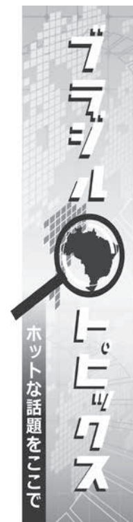
当地メディアの広範なニュース

行物体ドローンは近年、空からの監視用など様々な用途で使われる。しかし、普及と共に飛行場の飛行禁止区域に入ってしまう。飛行機の離着陸を妨害する原因の一つに