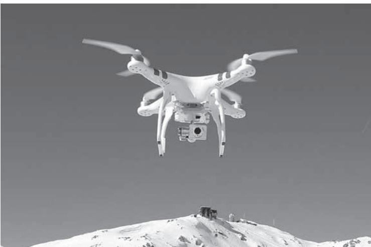
ドローンの普及が、飛行機の発着に影響を及ぼしている

行物体ドローンは近年、空からの監視用など様々な用途で使われる。しかし、普及と共に飛行場の飛行禁止区域に入ってしまう。飛行機の離着陸を妨害する原因の一つに