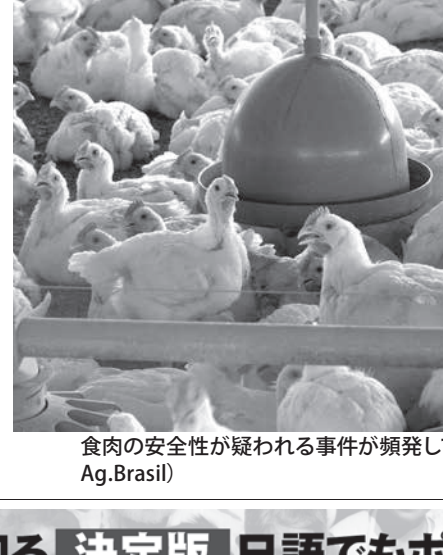
食肉の安全性が疑われる事件が頻発している(参考画像・Ag.Brasil)

大手メーカーの鶏肉回収命令 サルモネラ菌検出の疑いで 国家衛生監督庁(Anvisa)は14日、ペルジゴ社製生鶏肉の一部生産ロットを流通禁止すると発表した。ペルジゴ社は世界的食品コングロメット(複合企業体)BRFを形成する食肉メーカーで、流通禁止の理由は、製品にサルモネラ菌が混入している危険性があるためだ。食中毒の原因となるサルモネラ菌は、検査用の