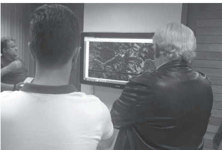
ダムが決壊した場合の被害シミュレーションを行うノーヴァ・リマ市(ノーヴァ・リマ市役所)

工法で建てられていた。鉱山局(ANM)は18日、国内に存在する積み上げ式工法のダムを2021年8月15日まで解体、もしくは使用停止にする事を決めた。住民の一時退避活動は、五つのダムの、使用停止計画の一環だ。