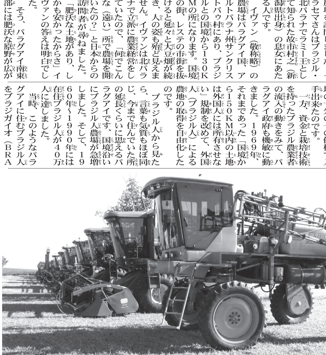
「4-1農場」にずらりと並んだ収穫用のトラクター（2010年撮影）

パラグアイの農業は、大豆が中心である。最近では、4-1農機が主流になり、効率的な大豆栽培が行われている。イヴァン氏は、この変化について詳しく述べている。