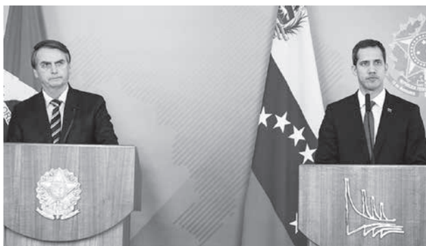
ボウチエロ暫定大統領(左)と、グアイド暫定大統領(右)

グアイド氏は支援物資搬入の2月23日を「決戦の日」に設定し、マドゥロ体制打倒の勝負に出たが、決定的な結果は挙げられないまま、週明けの2月25日にボゴタでのリマグレル諸国会議に参加。その後は南米各国を回り、支持を訴えている。