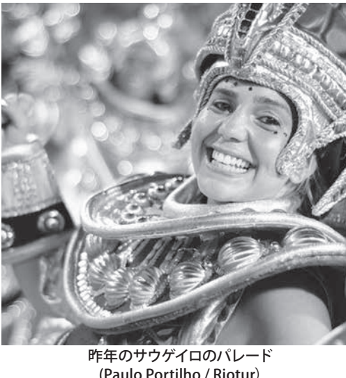
昨年のサウゲイロのパレード

「まだ見てない者はここで見る。ベネズエラ・フロア(テーマ)で、同エスココアの結成70周年を祝う。登場は初日の5番手で、4日午前1時35分の予定だ。初日1番手はグアイドウロ、その他の見どころは、サウゲイロ、ウニドス、グアイド、ウニドス、グアイド。グアイドウロは4年ぶりに1部昇格で、知名度はあまり高くないが、優勝請負人のカリス・カルナヴァレス、パウロ・ウケイロの守護神でもある。黒人文化に敬意を払いつつ、黒人蔑視と言える発言を行ってきた、ボウチエロ大統領やマルセロ・クリウセラ・リオ市長、ウイリソン・グアイデル、リオ州知事への批判を含んだ政治的な内容になりそうだ。登場は4日0時30分。古豪のチジユカは、「過去の歴史」を描く内容で5年ぶりの王座奪回を目指す。登場は3時45分。2日目の見どころは、ボルテラ、パラライド、