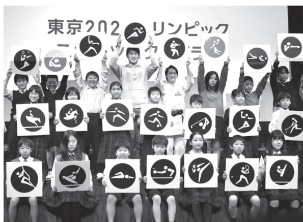
2020年東京五輪で使用される「ピクトグラム」を小学生と一緒に発表する陸上男子の飯塚翔太選手(上段中央)と空手女子の清水希容選手(その右隣)=12日午前、東京都江東区