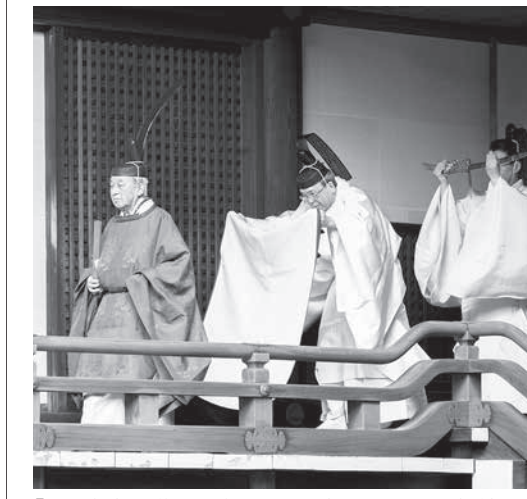
「期日奉告の儀」に臨まれる天皇陛下=12日午前、皇居・賢所

共同で居住棟を開発するほか、米欧と共に物資輸送を担う。新ステーションは「ゲートウェイ」と呼ばれ、米欧が主導。2022年の建設開始、26年ごろの完成を目指す。