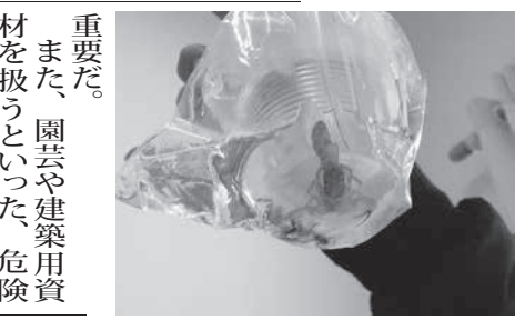
化学物質(農業)は、有効性がまだ実証されていないと、使用を勧めていない。

9月以降の悪い結果だ。特に目立つのが「資本財」で、前月比マイナス3.4%のマイナス。中間財も0.1%のマイナスだった。