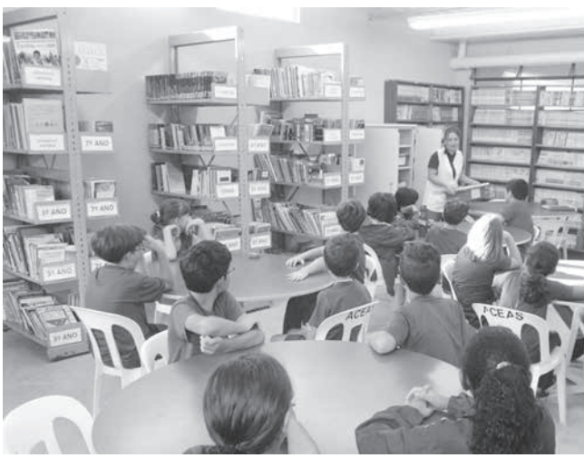
スザノ日伯学園の図書館の様子

聖市近郊のスザノ市にある州立学校で13日朝、教師や生徒ら8人が殺害された銃乱射事件を受けて、地元日系社会に動揺が広がっている。事件当日、市内他校も襲撃されたとの噂が流れ、市内の日系私立初等学校「スザノ日伯学園(CENIBRAS)」にも子供を保護するに備えて押し寄せるなど混乱が広がった。同校は高学年を対象に説明会を実施して心のケアにあたり、来週早々にも今回の犯行と関連性があると思われるゲームと仮想現実について同校駐在の心理士が講義する予定という。矢継ぎ早に対策に乗り出している。(2面に詳報)