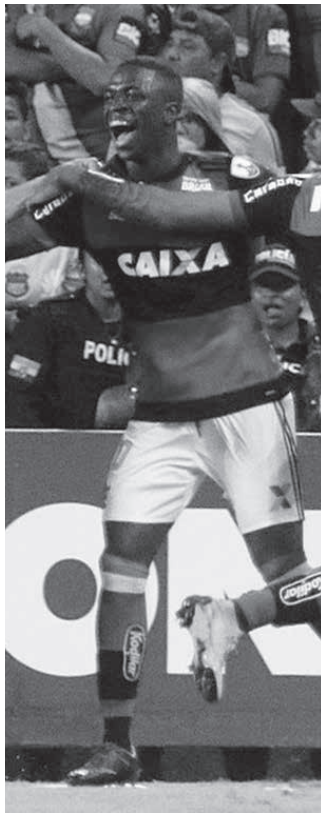
18年3月ベルタドール杯でプレーするウイニシウス・ジュニオル

伯人サッカー連盟(CBF)は、2015、16、17、18年の各年の、ブラジルチーム所属の伯人選手たちの国外移籍事情をまとめた表を発表した。