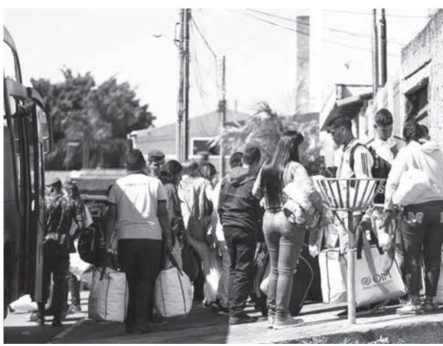
ブラジルに到着したベネズエラ難民たち

【既報関連】政治危機が深刻化し、経済危機が深刻化し、母国ベネズエラから難民として周辺諸国に逃げ込むベネズエラ人が後を絶たない。