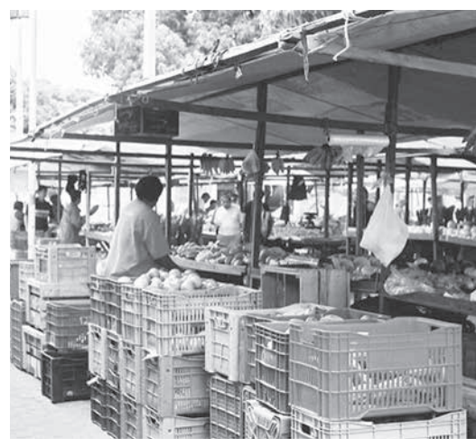
フォルタレーザでの青空市の様子

地理統計院(IBGE)は12日、2月の広範囲のインフレ率を発表した。インフレ率は0.43%だったと発表した。