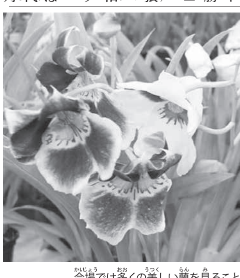
寿組で優勝したマチウデ

「寿組」優勝「サントア」2位「エスタシ」3位「カロン・キ」3位「マチュウデ」ヨウウ、2位「鶴組」優勝「アルジャ」2位「サガA」3位「マチュウデ」