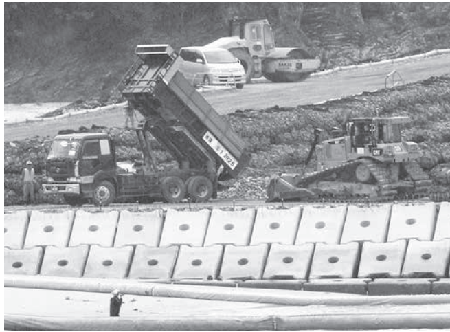
沖縄県名護市辺野古の沿岸部の新たな区域に投入された土砂(中央) = 25日午後

辺野古、沖縄県の反発必至 政府、作業開始を通知 【共同】政府は25日、米軍普天間飛行場(沖縄県宜野湾市)の移設先、名護市辺野古の沿岸部で、新たな区域へ土砂を投入する。2月24日の県民投票で7割超が埋め立て反対の民意を示した中で、工事が次の段階に進むことに県側が反発を強めるのは必至だ。防衛省沖縄防衛局は25日午前、県に同日中の作業開始を通知した。 政府関係者によると、汚濁の広がりを防ぐ設備の設置などが整った後、午後にも土砂を投入する。周辺海上には移設に反対する市民らがカヌーや小型船で繰り出し、抗議活動を展開した。 新たに土砂を投入するのは、埋め立て海域南側の護岸で開かれた約33ヘクタールの区域。政府は昨年12月に土砂を投入し、現在も作業が続く。約6.3ヘクタールの区域の西に隣接する。 防衛省の移設計画では、全体で約160ヘクタールを埋め立て、2本の滑走路を整備する。ただ、海東側には地盤改良が必要な軟弱地盤が広がっており、工期の長期化は不可避との見解を示している。玉城デニー知事は地盤改良工事「不可能だ」と明言しており、改良に向けた手続きの申請は認めない方針だ。 菅義偉官房長官は25日の記者会見で「地元との理解と協力を得る努力を続けながら関係法令に基づき、自然環境や住民の生活環境にも最大限配慮して作業を進めていく」と強調した。岩屋毅防衛相は参院予算委員会で、土砂投入に「気象条件などを検討した結果、工事を進めたい」ということで県に届け出たと述べた。地盤改良を巡る設