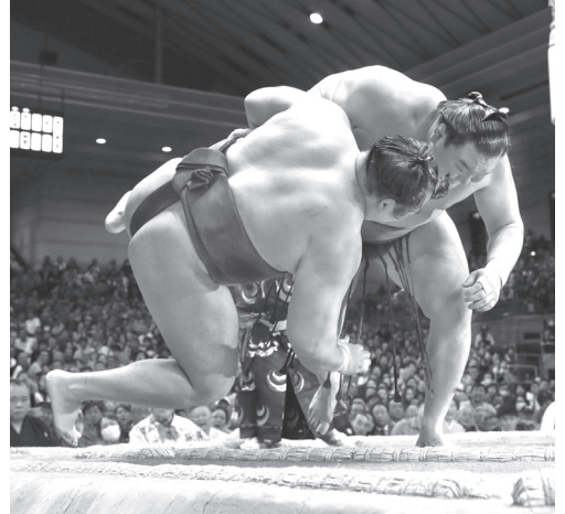
白鵬(右)が下手投げで鶴竜を破り優勝を決める=エディオンアリーナ大阪

横綱白鵬(34)は本名ムンフバト・ダバジャルガル、モンゴル出身、宮城野郎屋IIが42度目の優勝を全勝で飾った。貴景勝は鋭い突き、押しを武器に、小結だった昨年九州場所では13勝2敗で初優勝。新関脇の先場所では11勝を挙げ、昇進の目安とされる3場所合計33勝を上回り、34勝となった。