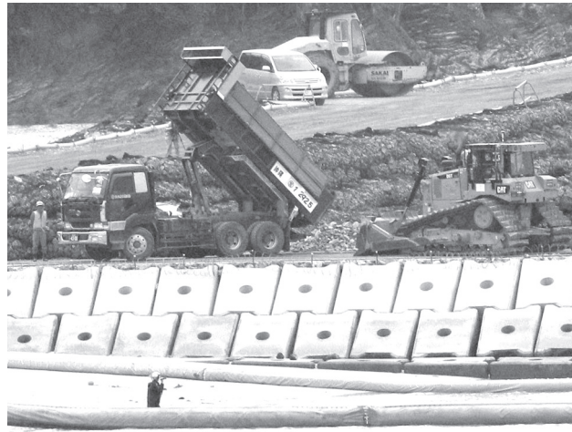
沖縄県名護市辺野古の沿岸部の新たな区域に投入された土砂(中央)=25日午後

【共同】海上での抗議を尻目に、工事用車両は黙々と土砂を投入し続けた。米軍普天間飛行場の移設に向け、沖縄県名護市辺野古沿岸の新たな区域で政府が埋立てに着手した25日。「まだ止められる。諦めぬい」。辺野古移設を阻止しようとする人々は気勢を上げた。