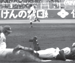
山梨学院の三塁手、二塁手、一塁手、捕手、投手、遊撃手、内野手、外野手、ベンチメンバー

【共同】選抜高校野球大会第3日は25日、甲子園球場で1回戦3試合が行われた。盛岡大付は21世紀枠で初出場の石岡一(茨城)に延長11回、サヨナラ勝ち。山梨学院は1回戦、左野村三走を放ち、三塁、二塁、一塁を回し、サヨナラ勝ち。