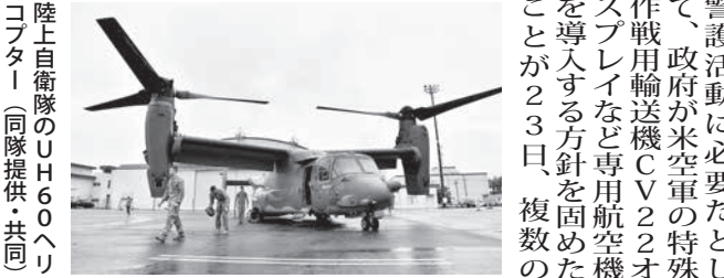
陸上自衛隊のUH60ヘリコプター

【ソウル共同】韓国中部の大田地裁は25日、元朝鮮女子挺身隊員らが三菱重工に賠償を求めた訴訟を巡り、韓国最高裁での取捨決定後も賠償支払いを拒否している同社の資産差し押さえを認める決定を出したと、申請していた原告側が伝えた。支援団体は同日声明を発表し「三菱重工が誠意ある態度を示さなければ、換金(資産売却)手続きを切れ目なく進めていく」と警告した。 声明によると、地裁が差し押さえを認めれば三菱重工の資産は、請求した商標権2件と特許権6件の全て、原告側は、これら資産は原告4人分の損害賠償金と遅延損害金(計約8億ウォン、約770万円)に相当する価値があるとみて、差し押さえにより三菱重工は商標権などの権利を失うことになる。原告側が売却に踏み切れば、日本企業は企業に実害が出ると判断し対抗措置を取らざるを得ない。韓国側も相応の措置を検討しているもようである。日韓関係は極度に悪化しそうだ。 韓国の裁判所は1月、新日鉄住金の資産差し押さえも決定しており、元