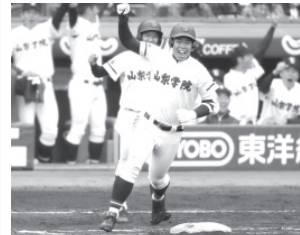
山梨学院一塁手、二塁手、三塁手、捕手、投手、遊撃手、内野手、外野手、ベンチメンバー