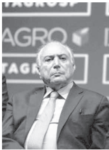
テメル前大統領

前大統領の釈放を決めたのは、連邦第2地域裁判所(2RF-2)のアントニオ・イヴァン・アチエ判事だ。前大統領と同じ容疑で逮捕されていたモレイラ・フランコ元リオ州知事、元軍警のジョアン・パチスタ・リマ、ファイリョ氏ら6人も同時に釈放された。