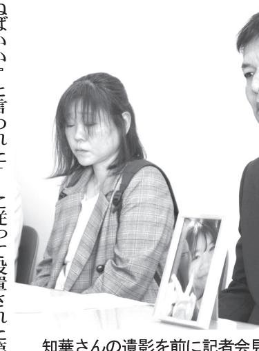
知華さんの遺影を前に記者会見する両親＝26日午後、熊本県庁

【共同】熊本県北部の県立高校3年の女子生徒（17）が、いじめを受けたことと、いじめの被害を受けたこととを理由に自殺した問題で、熊本県教育委員会が最終報告書を公表した。 報告書によると、いじめは、いじめの被害を受けたことと、いじめの被害を受けたこととを理由に自殺した問題で、熊本県教育委員会が最終報告書を公表した。