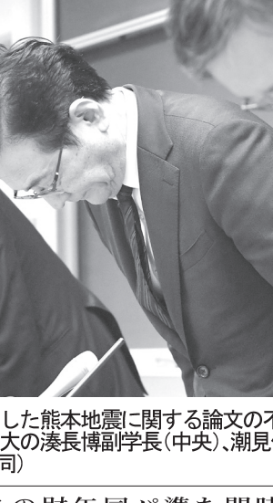
アップルの最高経営責任者（CEO）は本社があるカリフォルニア州クパティノでの発表会で、「素晴らしい物語を通じて、文化や社会に貢献できると感じている」と述べた。

アップルは25日、映画など独自の動画配信サービス「アップルTV+」を開始する計画を発表した。 アップルは25日、映画など独自の動画配信サービス「アップルTV+」を開始する計画を発表した。