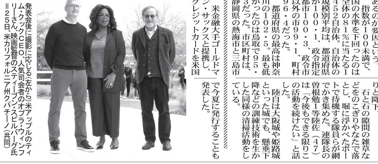
発表会後に撮影に際してアップルのティム・クック（左）、CEOのティム・クック（中央）、スピルバーグ氏（右）ら＝25日、カリフォルニア州クパティノ

アップルは25日、映画など独自の動画配信サービス「アップルTV+」を開始する計画を発表した。 アップルは25日、映画など独自の動画配信サービス「アップルTV+」を開始する計画を発表した。