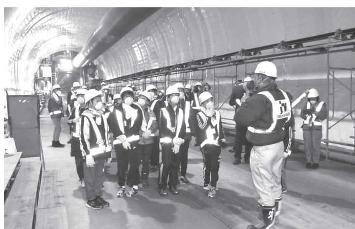
北海道新幹線が延伸する渡島トンネルを見学する参加者ら＝26日午前、北海道北斗市（共同）

建設中の新函館北斗―札幌（約21キロ）の8割はトンネルで、掘削で出る約1950万立方メートルの土砂の処分地確保が課題となっている。26日は、山岳トンネルとして国内最長の約3.7キロとなる予定の渡島トンネル（北海道北斗市など）で、北海道と青森県の小学生向けの見学会が開かれた。