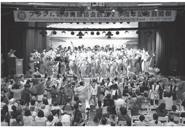
カチャーシーでは会場一体となり踊った