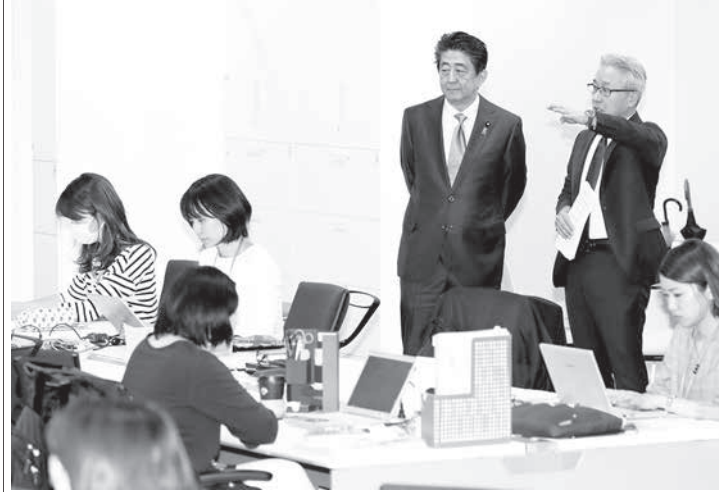
働き方改革の取り組みを視察するため「味の素」本社を訪れた安倍首相

【共同】安倍首相は29日、東京都中央区にある食品メーカー大手「味の素」本社を訪れ、働き方改革の取り組みを視察した。時間外労働（残業）への罰則付きの上限規制などが4月1日に施行されるのを控え、自ら先進的な企業を訪れ、他企業にも実践を促すのが狙い。首相は「改革には企業側、働く側からいろいろ懸念が出たが、杞憂と証明してくれた」と語った。