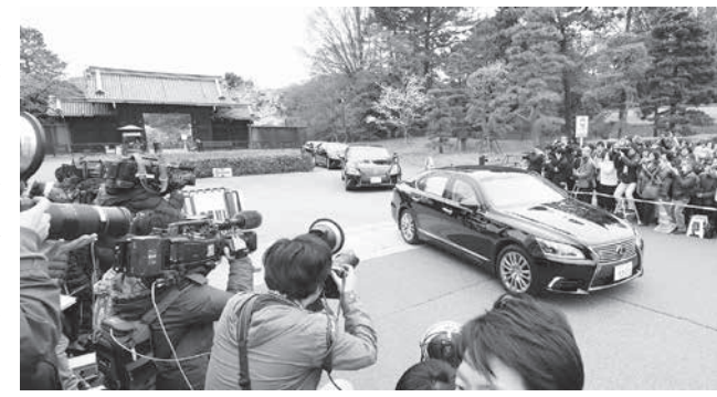
菅氏は会見で、首相が新元号決定後に会見する理由について、新元号に込められた意義や国民へのメッセージを直接伝えるためだ」と説明。情報管理に関して

首相は29日午前11時半ごろの報道陣との面会を終え、皇居を出発した。天皇陛下と面会を終え、皇居を出発した。天皇陛下と面会を終え、皇居を出発した。