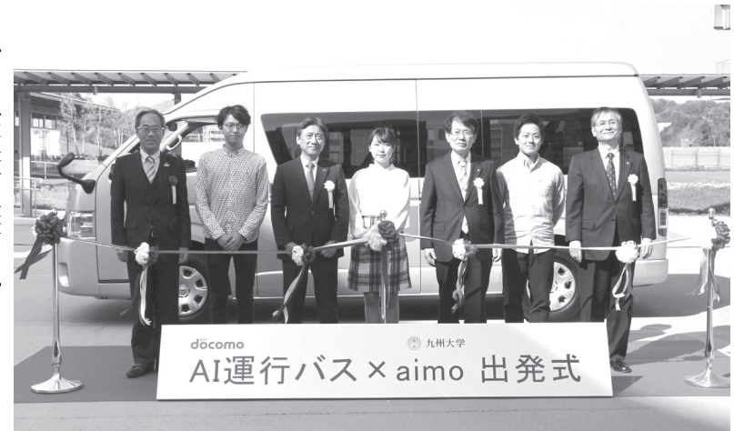
「デマンドバス」の商用運行開始を記念して九州大伊都キャンパスで行われた出発式＝2日午前、福岡市(共同)

AIで効率的に走るバス 九州大で本格運用開始 【共同】人工知能(AI)を使い、利用者の需要に応じて走る経路を柔軟に変える「デマンドバス」の商用運行が2日、九州大伊都キャンパス(福岡市)で始まった。NTTドコモとベンチャー企業「アイモ」が共同開発したシステムを活用して、このシステムを使ったバスの本格導入は初めて。 バスの名称は「aimo(アイモ)」で、学生や教員がキャンパス内を移動する際に利用する。運転手を含めて9人乗りの車両で、最大5台をシステムに対応させる予定。利用者が乗車場所と降りる地点をスマートフォンアプリで入力する