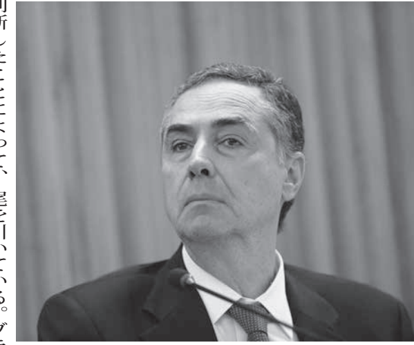
パロゾ判事

最高裁判事のルイス・ロベルト・パロゾ判事は1日、「2審判決後に刑執行」との判断を崩し、最高裁は機能(正当性)を失ってしまっているが、パロゾ判事は同件に関して、「最高裁は民主主義の柱的な存在だ。判例を簡単に壊すことはできない」とし、「判断を変えてしまおうとすることがあれば、最高裁は社会の感情に接した上、その後に行われるべきではない」と