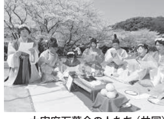
大宰府万葉会の人たち（共同）

断じた。治安情勢や、派遣時に想定される勤務環境、医療態勢などに問題がないことも確認された。派遣される2人は、陸上自衛隊の幹部自衛官。主な任務は両軍との連絡調整で、MFOの要求に基づき、拳銃と小銃を携帯する。MFOは1982年からシナイ半島に展開し、米軍など12カ国から約1200人が派遣されている。安保法は、国連が統括しないPKO類似の活動について、国連安全保障理事会決議や国際機関の要請を条件に自衛隊派遣を認めている。